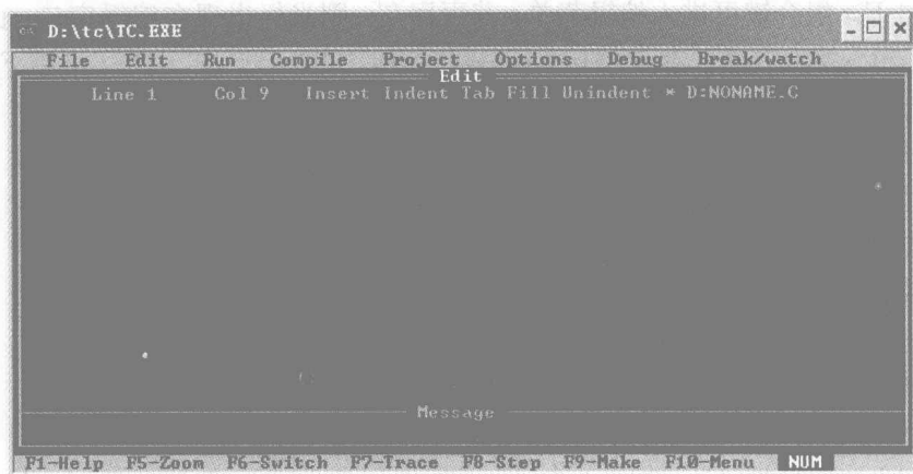
图 1.1 Turbo C 2.0 的主窗口

Turbo C 2.0的主窗口如图1.1所示。主窗口上半部分包括标题栏和菜单栏,中间窗口为编辑区,接下来是信息窗口,最底一行为功能键参考行。这四部分构成了Turbo C 2.0的主屏幕,以后的编程、编译、调试及运行都将在这个主屏幕中进行。