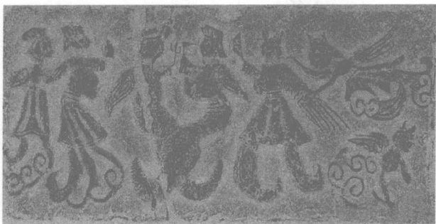
汉画——河南伏羲女娲画像砖

——燧人氏的时代，有巨人的印迹在雷泽之中出没，华胥踩到了巨人的脚印，在成纪（今甘肃天水）这个地方生下了庖牺（伏羲）。