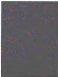
斑点图案装饰纸效果

相 机： 135 胶片单反机身 镜 头： 70-200 mm f2.8 变焦 胶 卷： 135 反转片 背 景： 黑色背景布 其 它： 三脚架、快门线