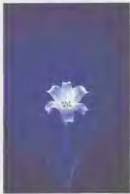
《花非花》系列之一(获第五届中国金像奖作品)

第五届中国摄影金像奖获奖作品《花非花》系列是“丹青与乳剂”的巧妙融合。就是用一底多次曝光方法,把绘画艺术融入摄影之中,追求形式感,装饰性及视觉冲击力。而这次第六届中国摄影金像奖作品《清风竹影》系列,虽然也是采用一底多次曝光方法,但是与《花非花》系列有着本质上的区别。《花非花》基本是事先构思的画面并融进了绘画艺术,而《清风竹影》完全是把自