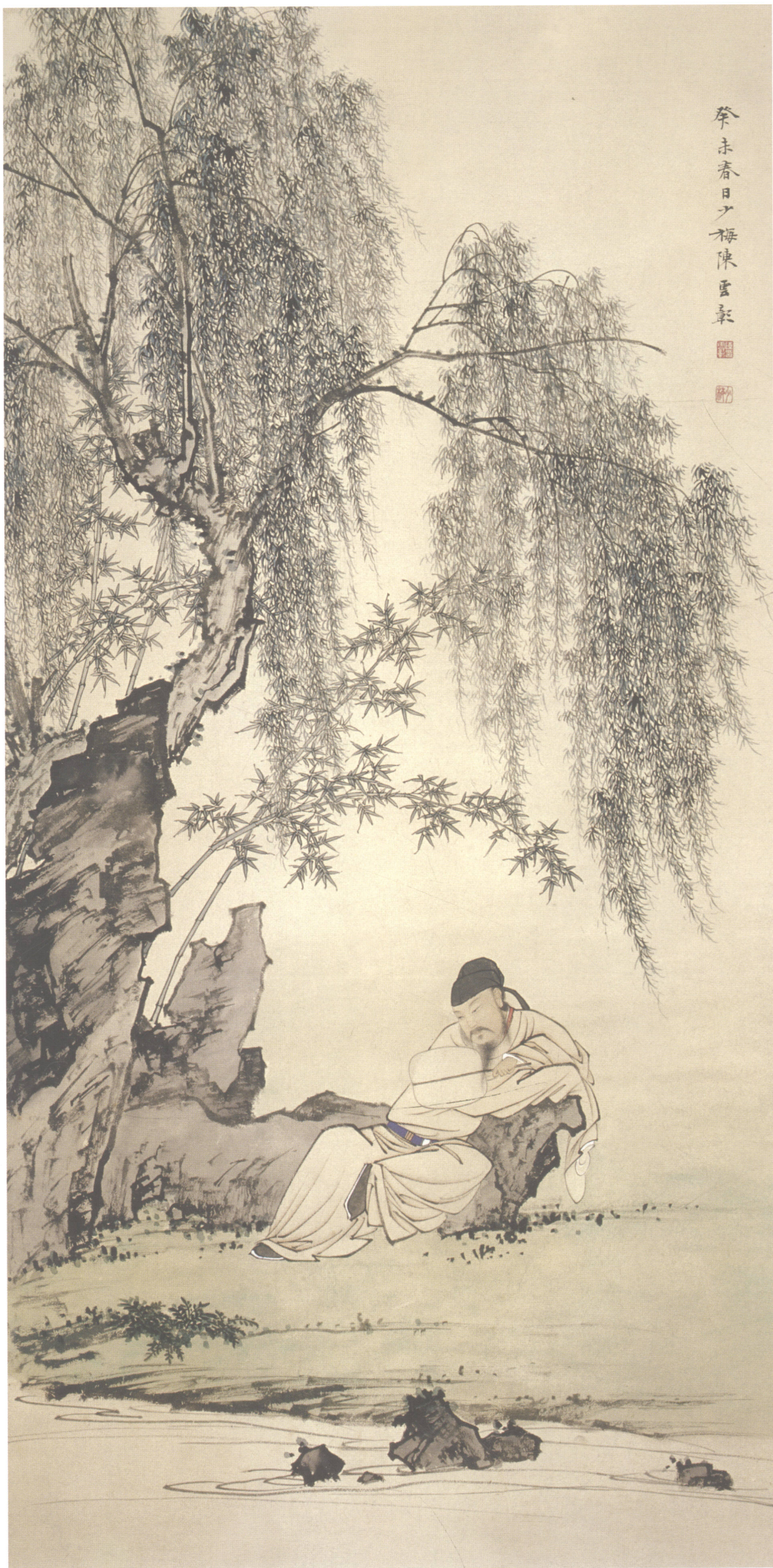
图 1. 高士图 52cm × 104cm