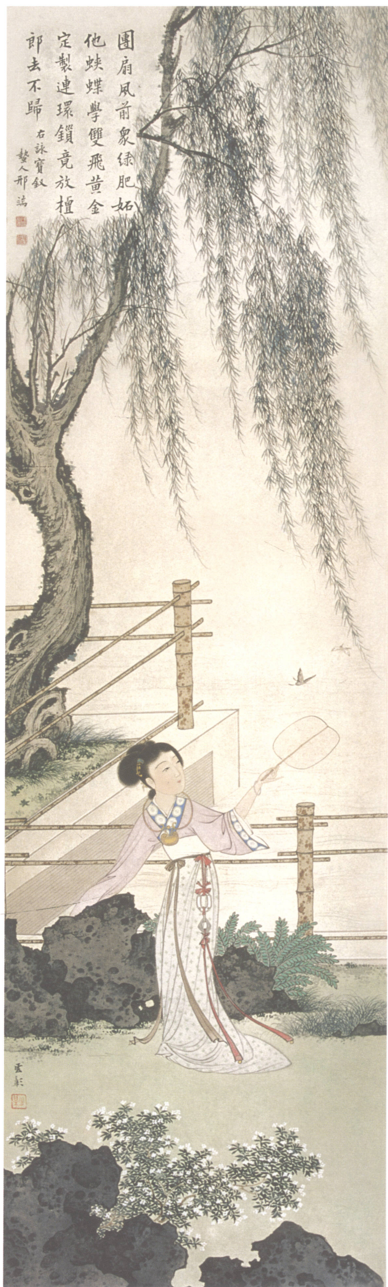
图 7. 金陵十二钗之六 30cm × 102cm