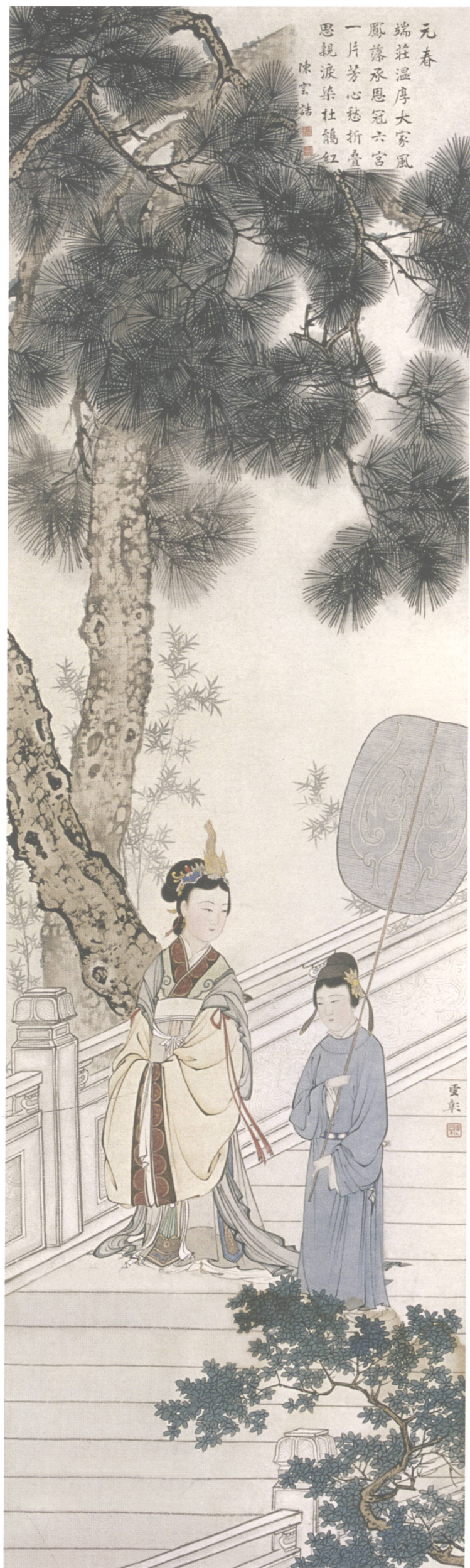
图3. 金陵十二钗之二 30cm × 102cm