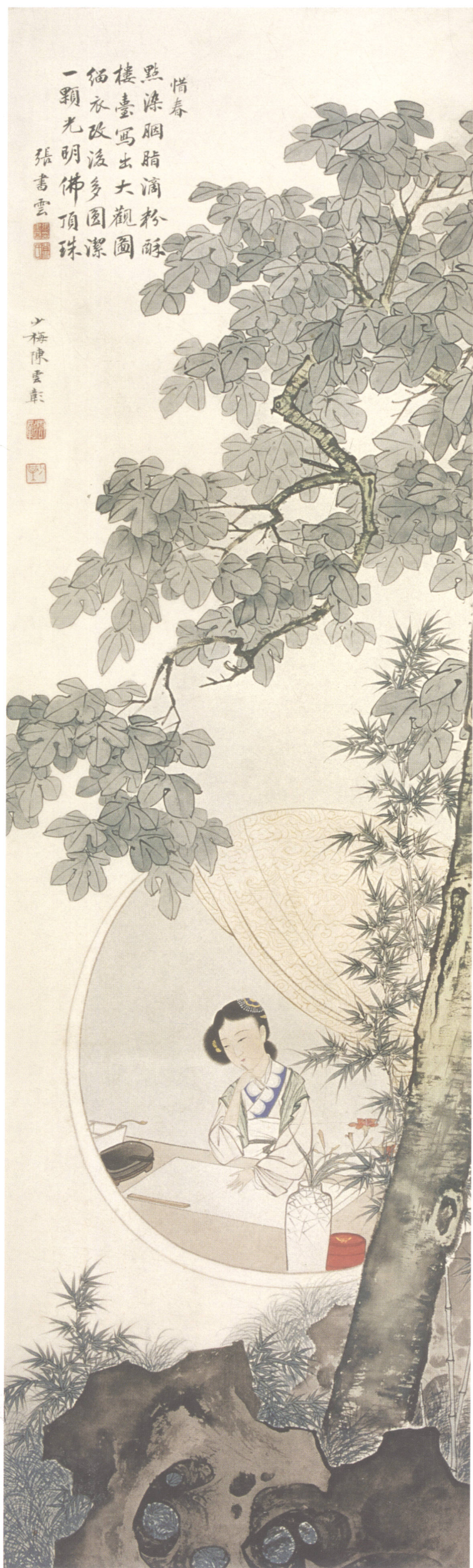
图 6. 金陵十二钗之五 30cm × 102cm