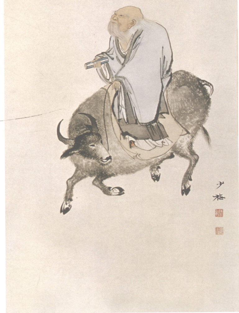
图 17. 人物四条屏之四 34cm × 101cm