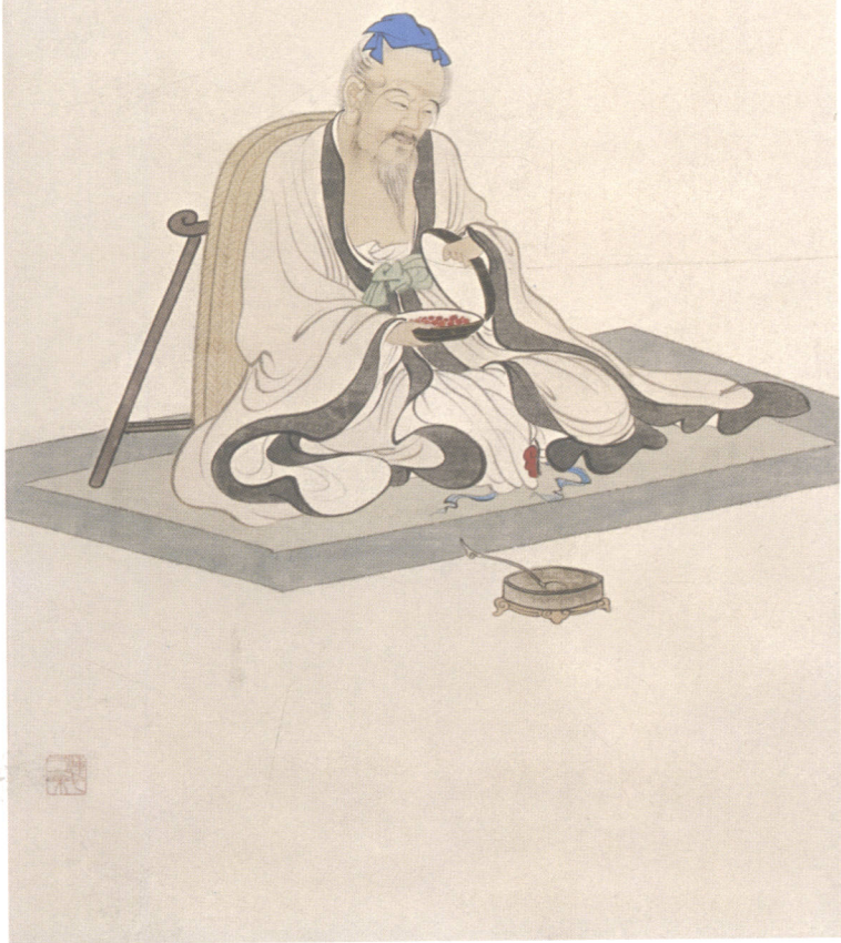
图 16. 人物四条屏之三 34cm × 101cm