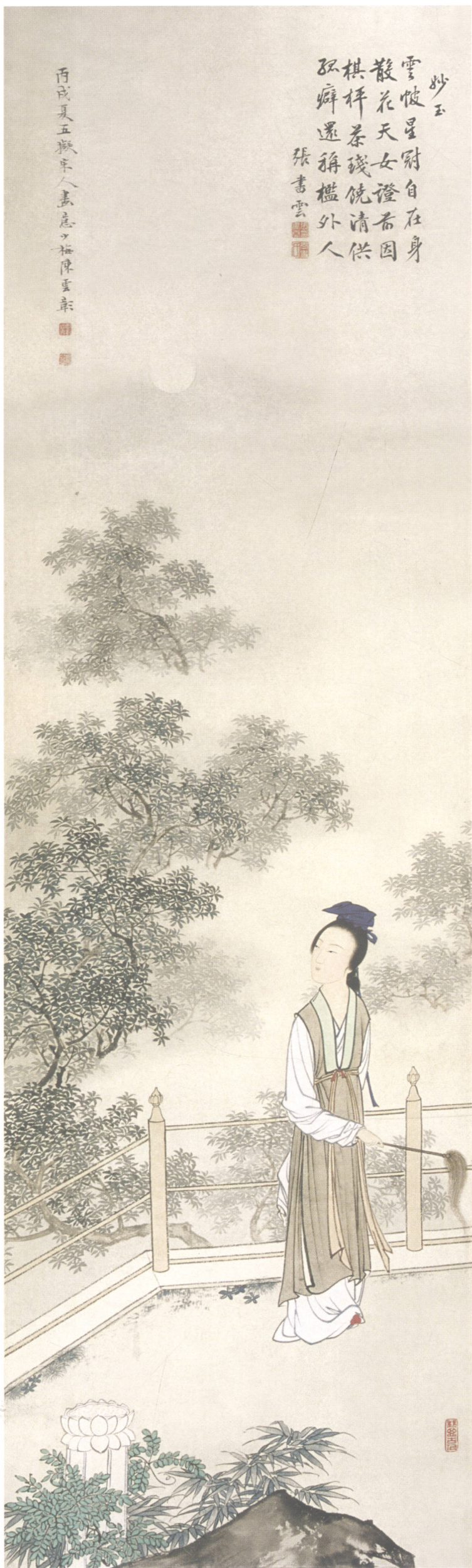
图 10. 金陵十二钗之九 30cm × 102cm