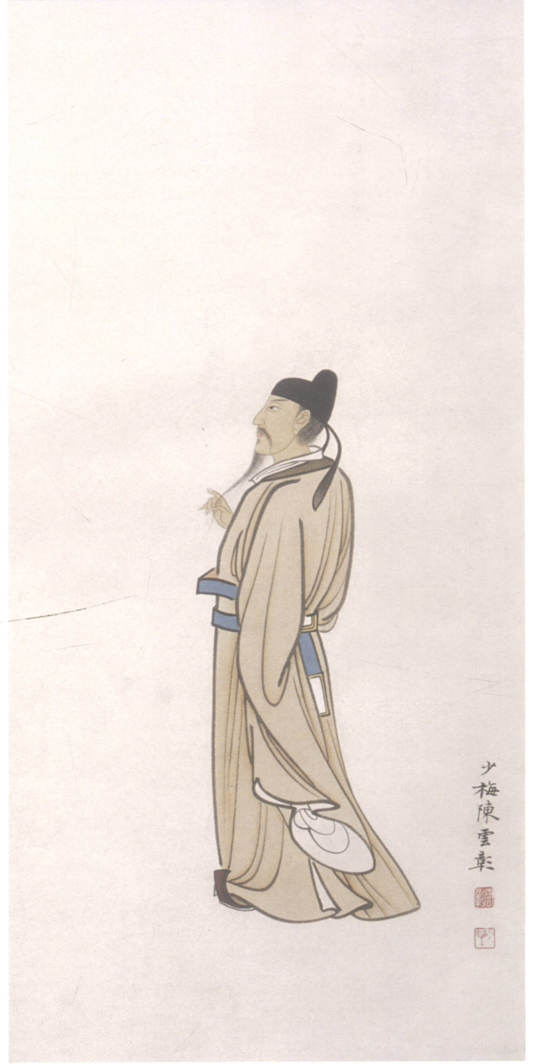
图 18. 人物四条屏之一 33cm × 98cm