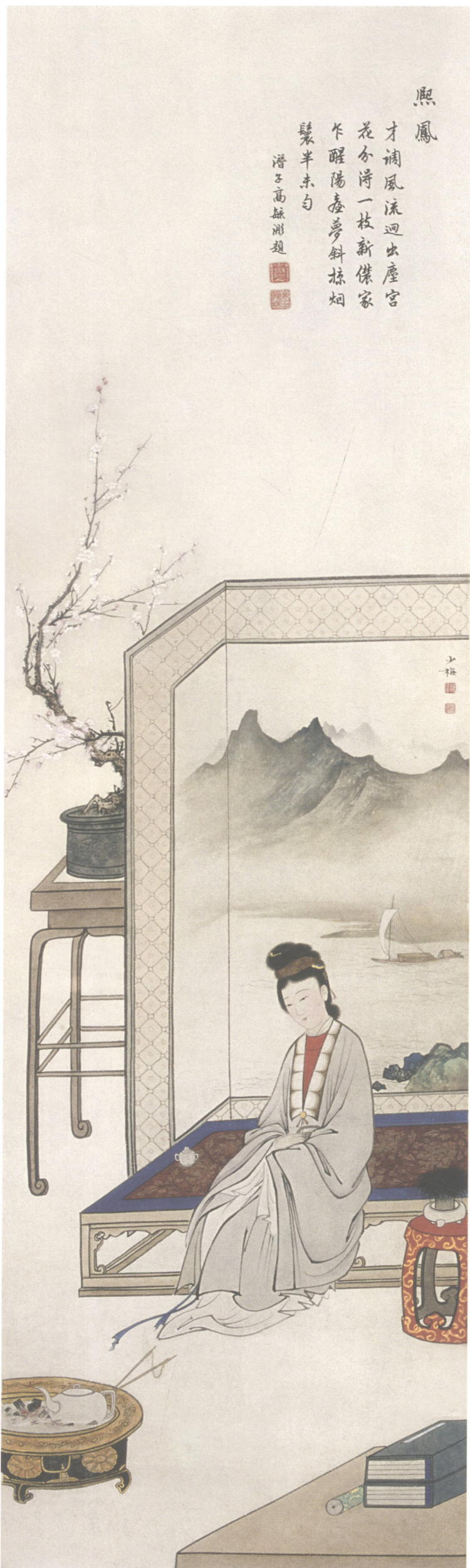
图2. 金陵十二钗之一 30cm × 102cm