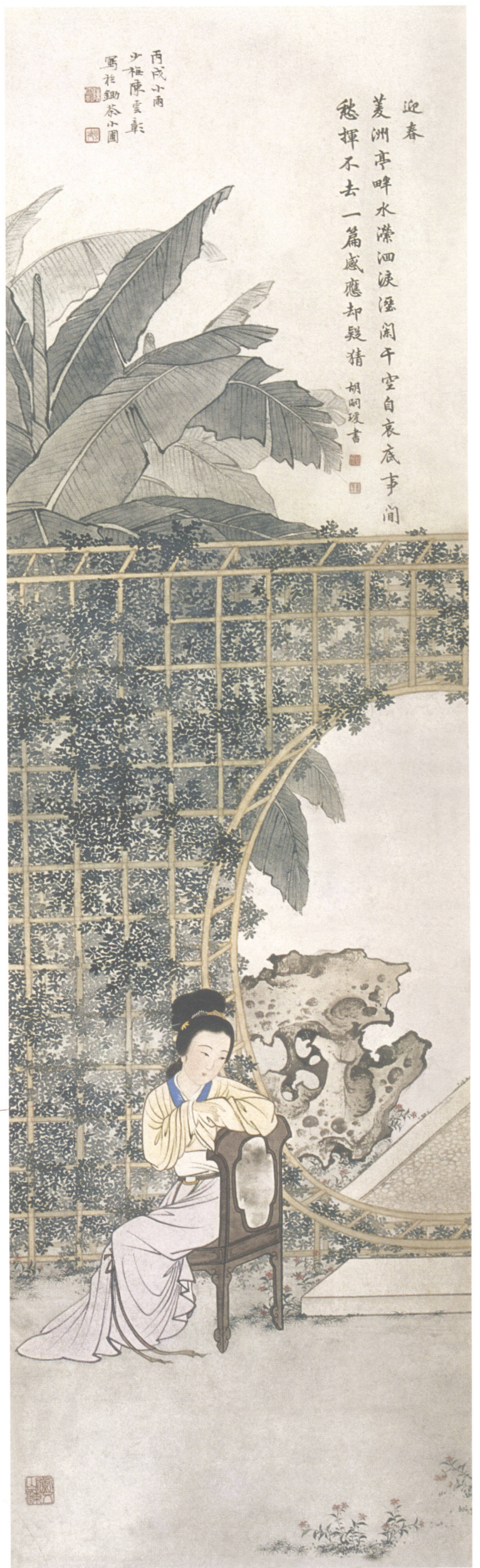
图5. 金陵十二钗之四 30cm × 102cm