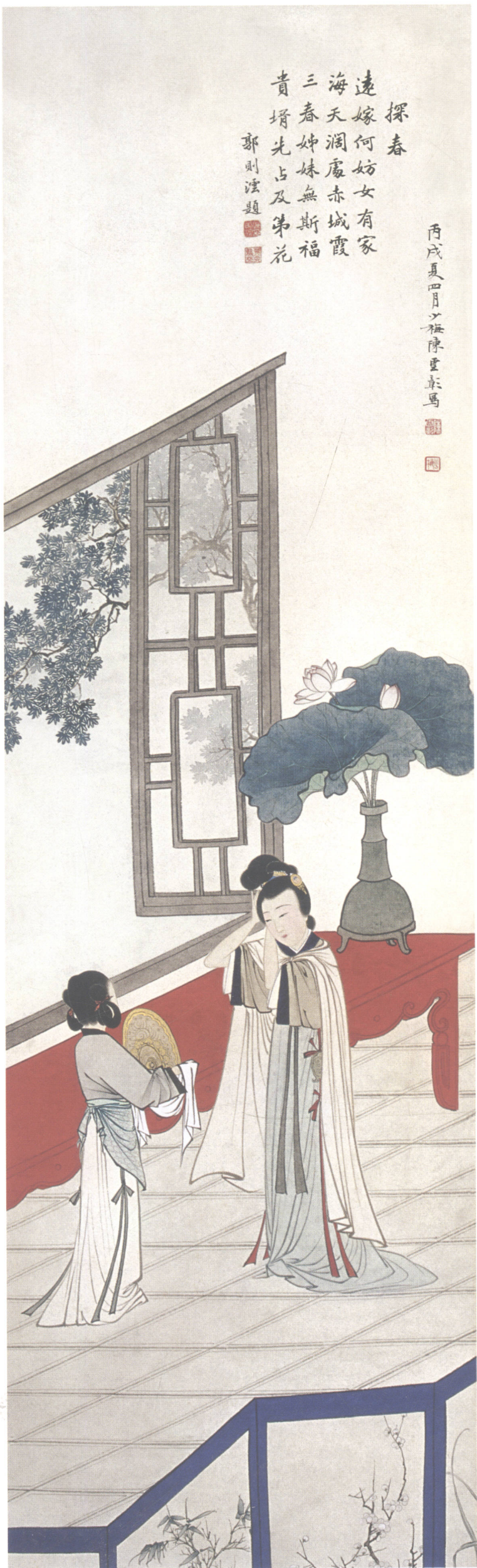
图4. 金陵十二钗之三 30cm × 102cm