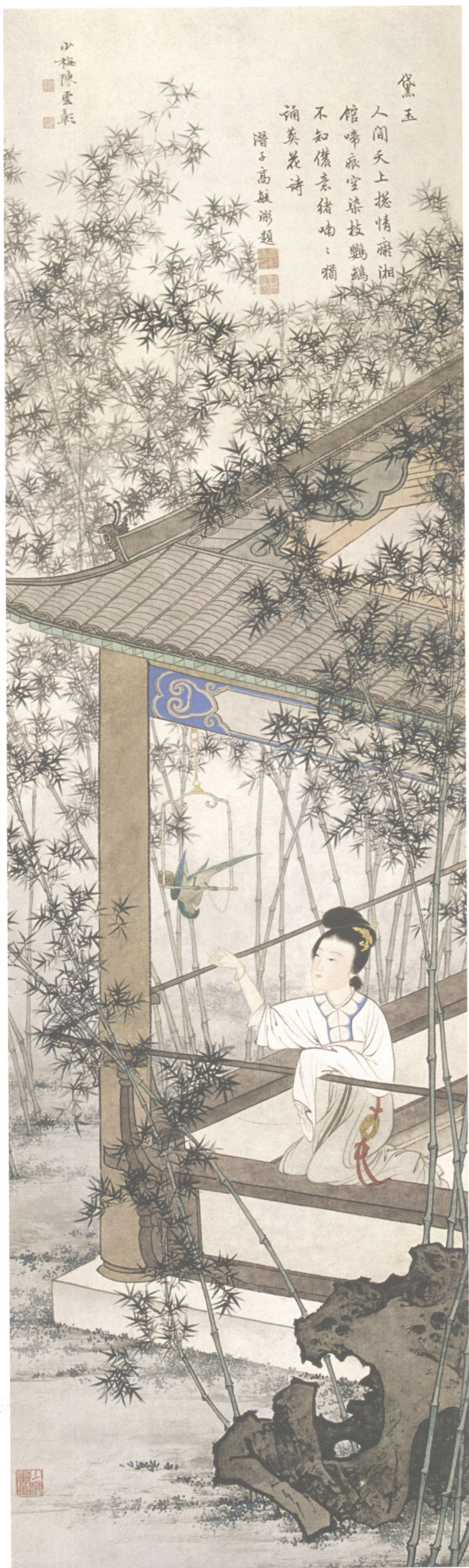
图8. 金陵十二钗之七 30cm × 102cm