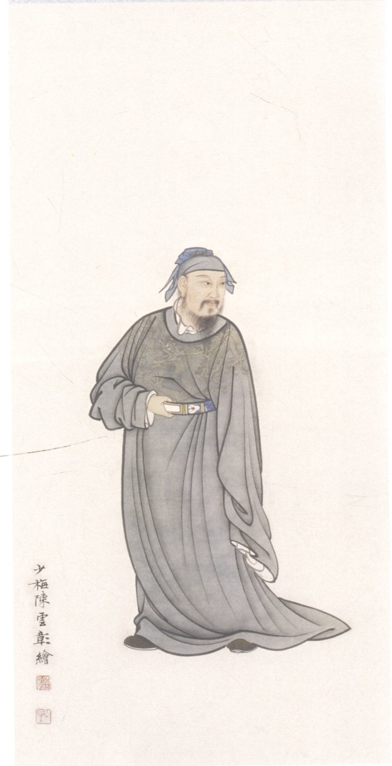
图 21. 人物四条屏之四 33cm × 98cm