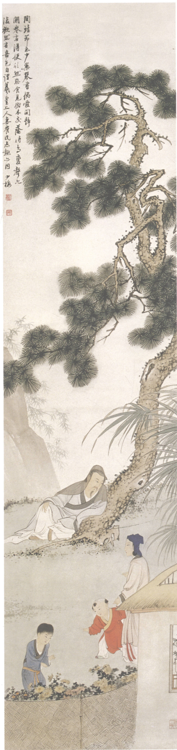
图 22. 松下同趣 31cm × 134cm