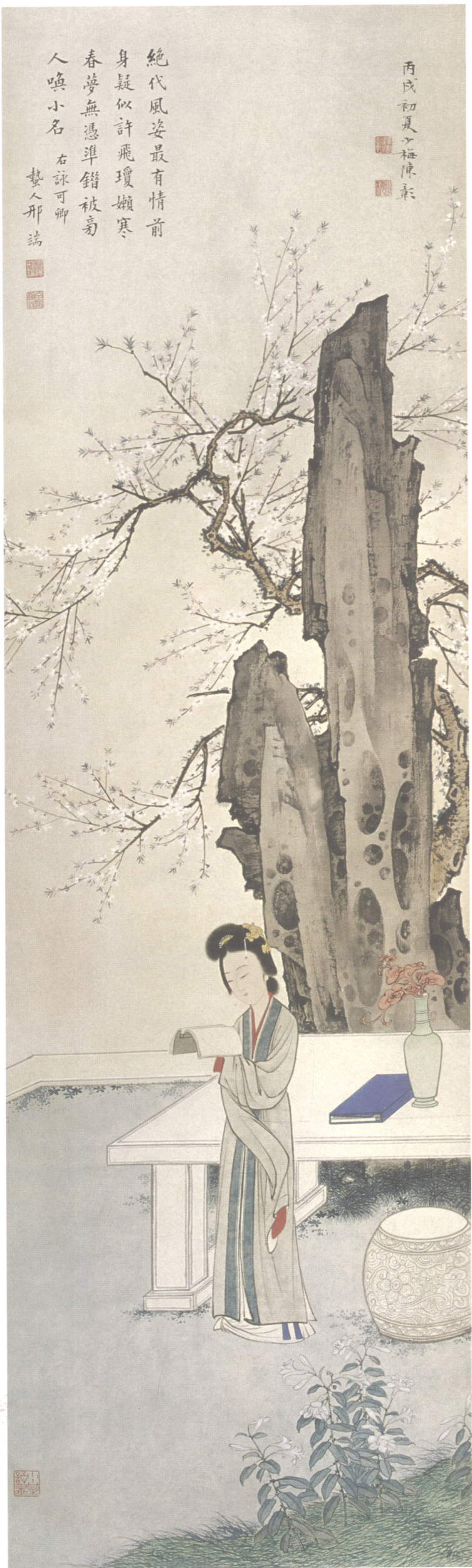
图 12. 金陵十二钗之十一 30cm × 102cm