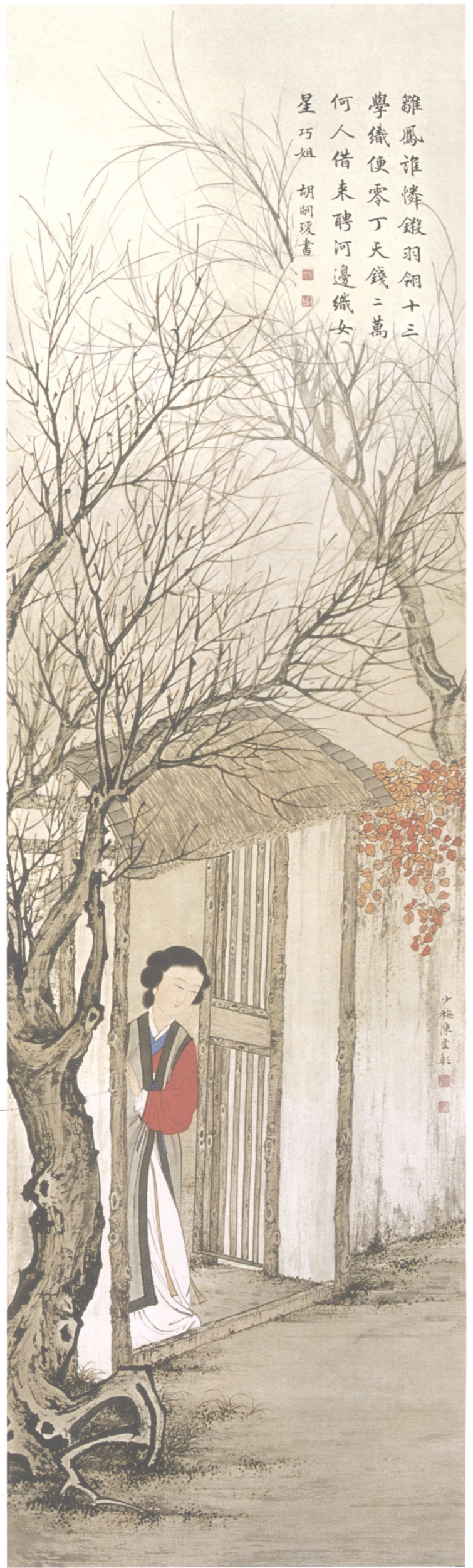
图 11. 金陵十二钗之十 30cm × 102cm