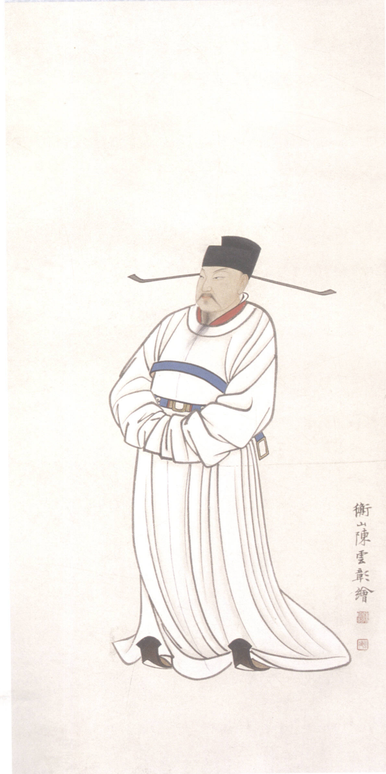
图 20. 人物四条屏之三 33cm × 98cm