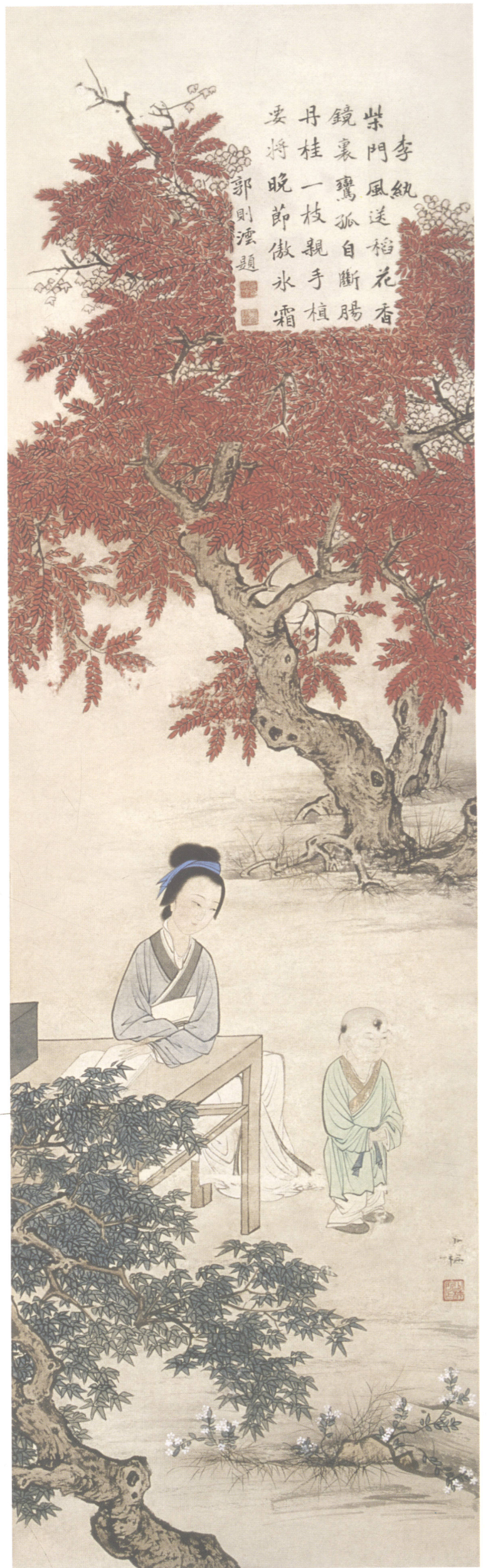
图 13. 金陵十二钗之十二 30cm × 102cm