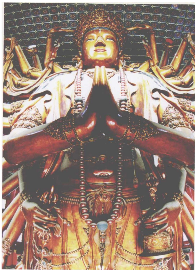
普宁寺千手千眼观世音菩萨