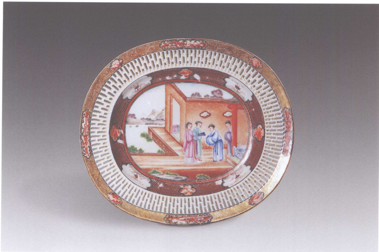
1. 乾隆广彩人物故事纹瓶