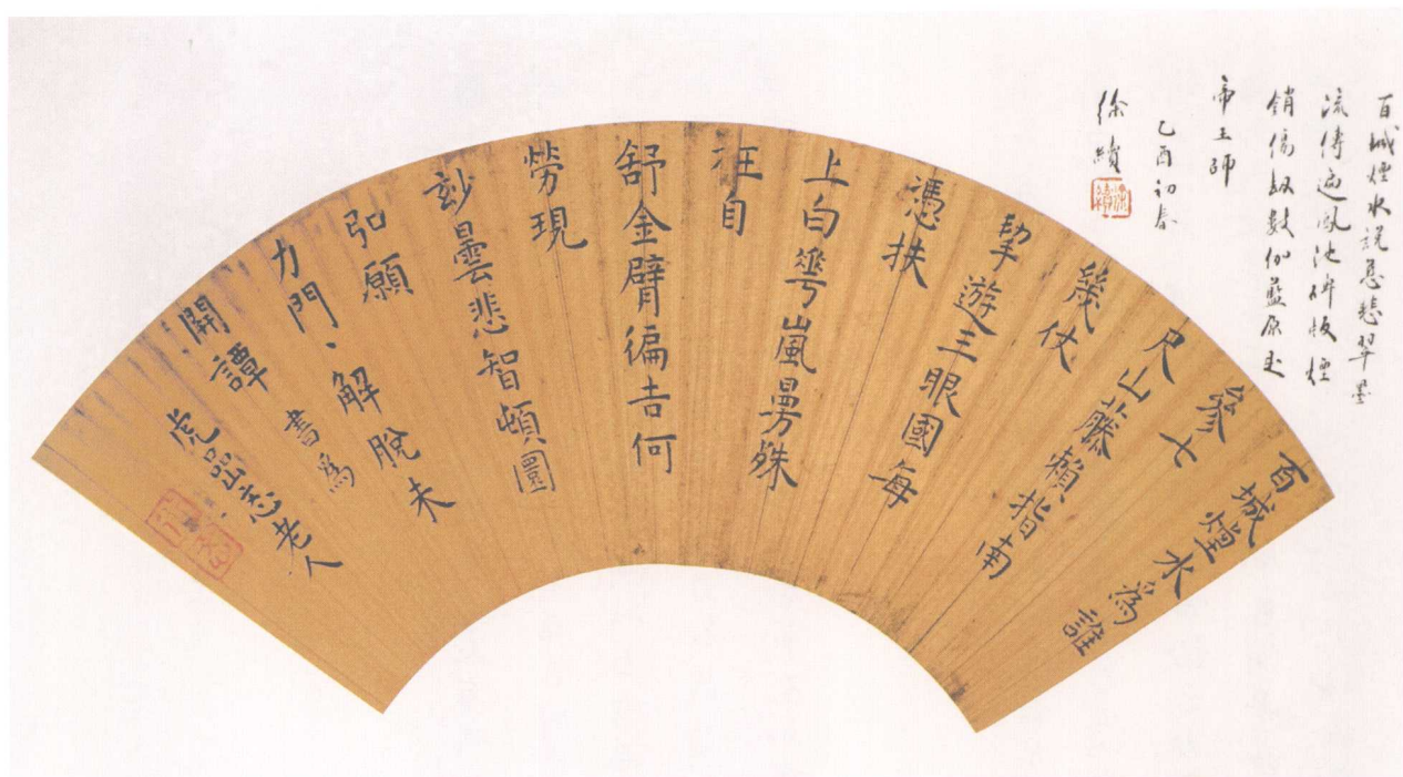
9. 木陈道忞七律自书诗扇面