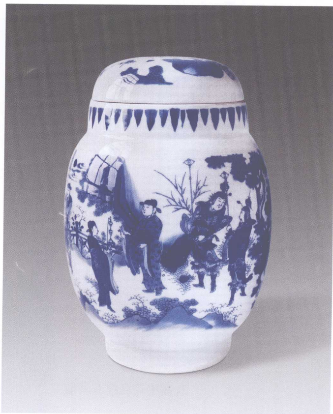
4. 明崇禎青花蘇武李陵故事圖罐