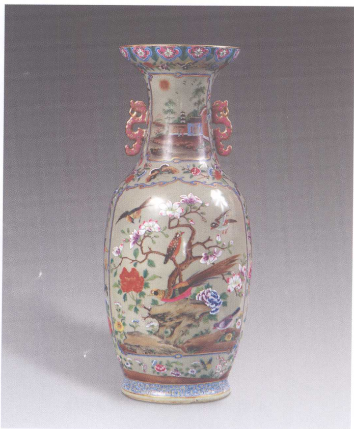
2. 嘉庆花鸟纹双耳瓶