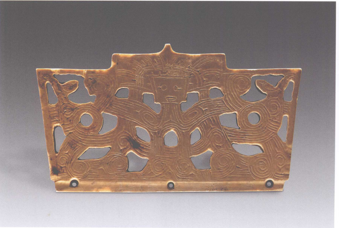
8. 反山 M15 冠状饰