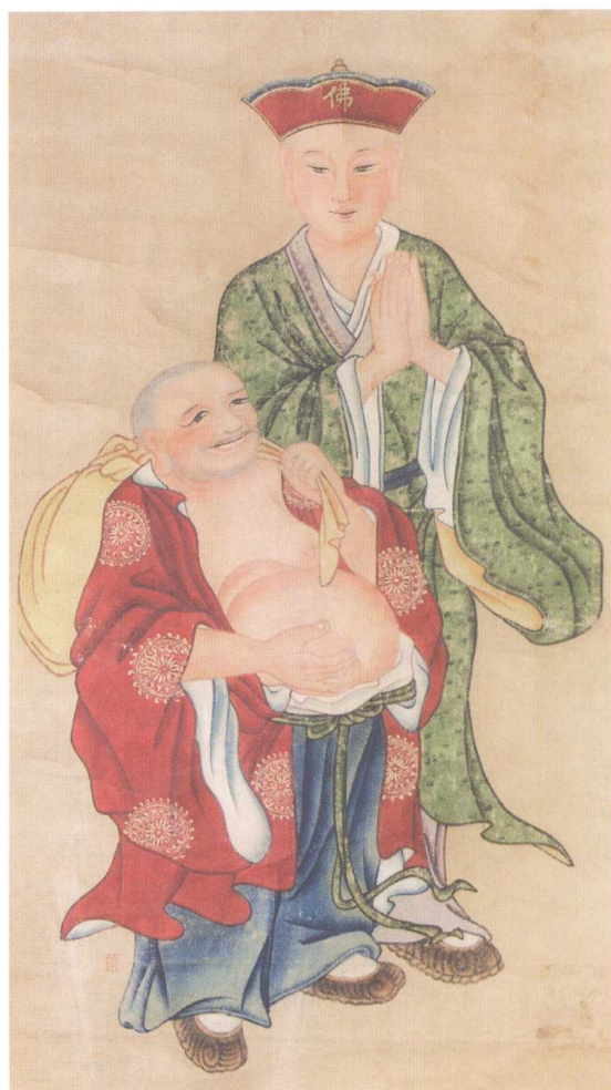
10. 广东佛山市博物馆藏水陆画罗汉像