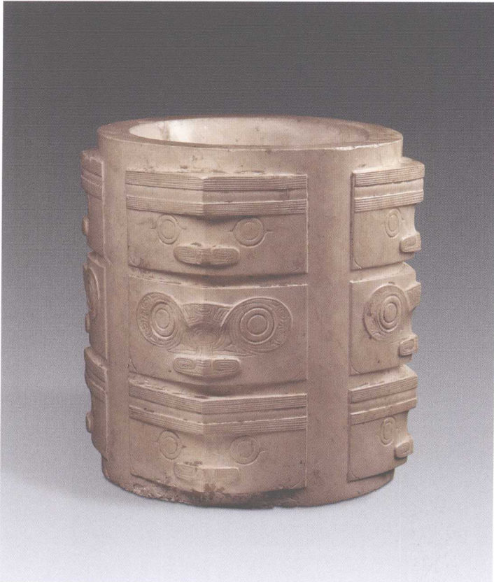
6. 反山 M12 玉琮