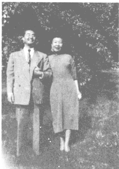
1945年，在白宫演出后与罗斯福总统夫人合影（左上）。