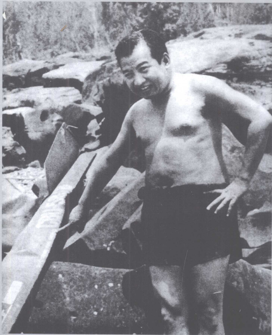
1973年，西哈努克亲王在河里洗澡时用手指着美国炸弹的余片。