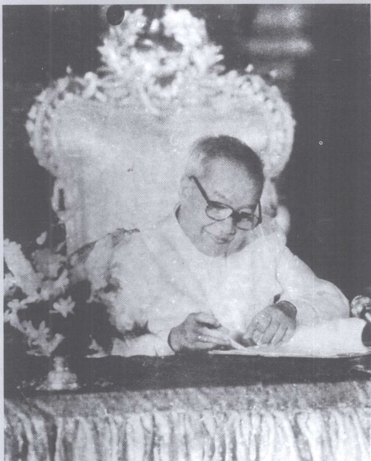
西哈努克亲王正在办公。