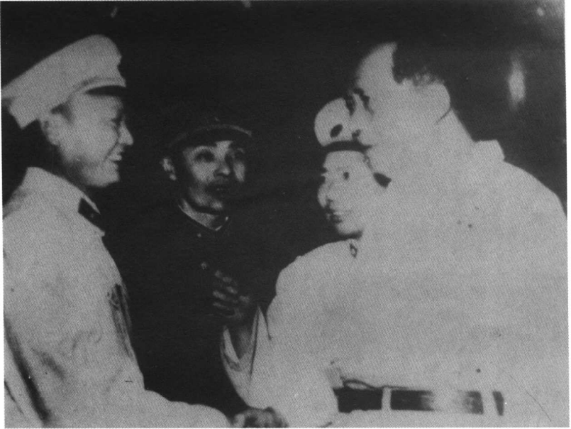
1958年,毛泽东同志由杨得志司令员陪同接见第二十六军军长陈宏、政委何志远