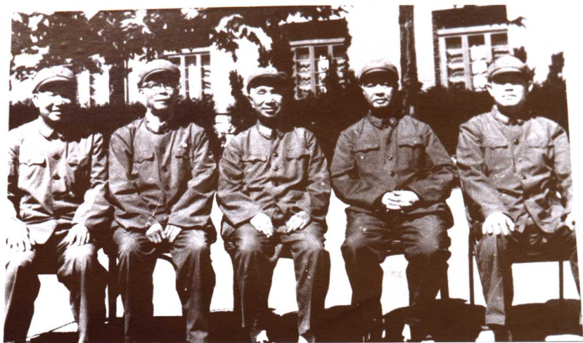
1979年，粟裕大将(中)与济南军区肖望东政委、第二十六军军长陈福胜(左一)、政委徐炜(右一)等同志合影