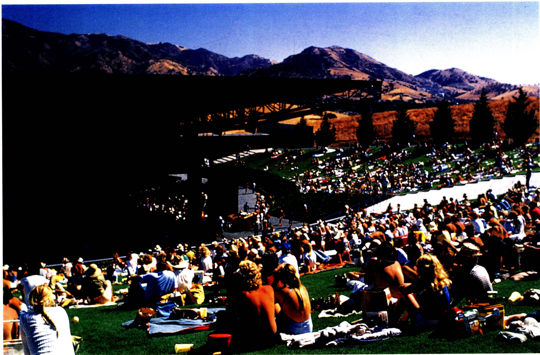
(上)协和音乐台, Concord, California