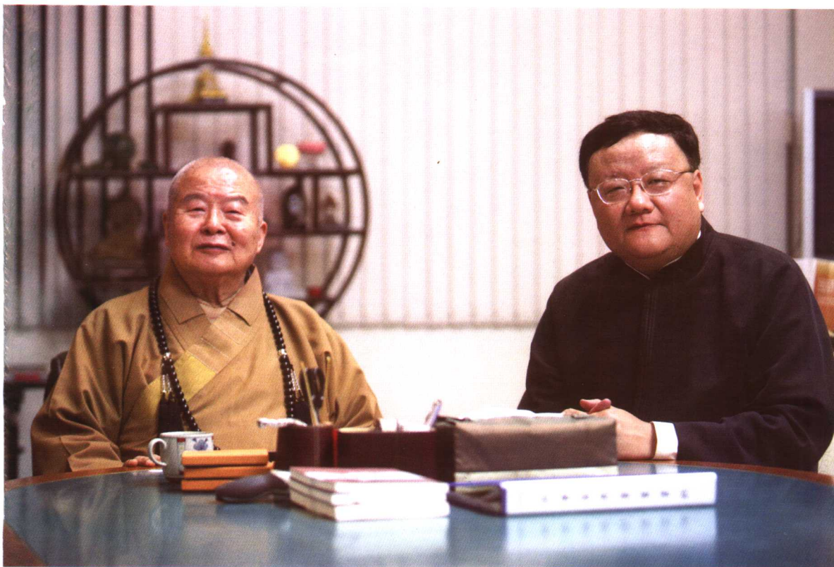
佛教高僧星云大师与凤凰卫视总裁刘长乐