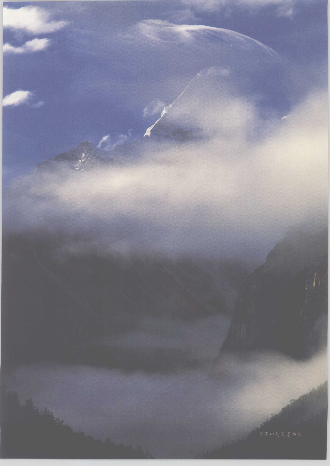
云雾中的夏诺多吉