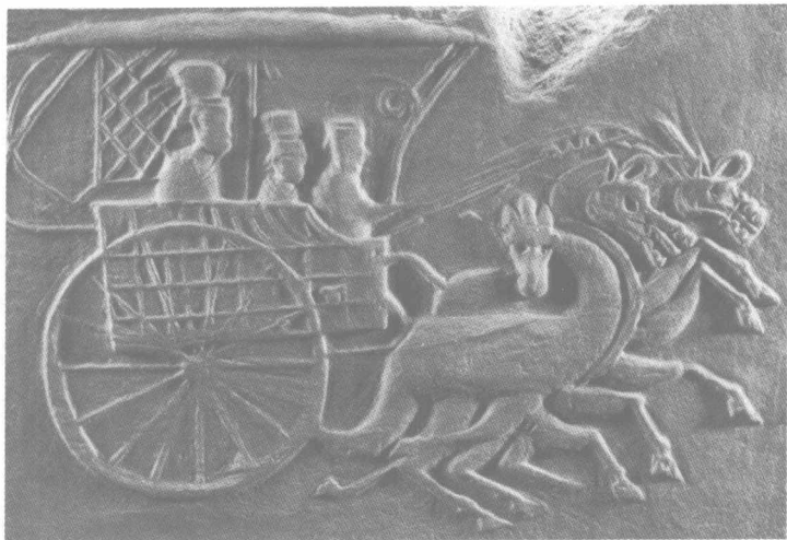
汉代轩车图画像砖。有菱形格幡,为轩车,是大夫以上官吏乘坐的车