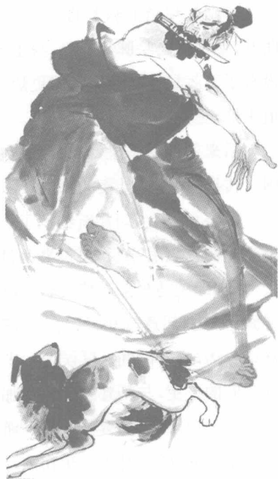
樊哙,原本为杀狗屠夫,后跟随刘邦,屡立战功,封为舞阳侯

樊哙气得要命:躲到河东了还没躲过刘邦,怪来怪去就怪那个老鳖驮刘邦过河。于是他就悄悄地把那老鳖杀了,放到锅里和狗肉一齐煮了。刘邦一吃感到比以前好吃,一问才知樊哙把老鳖杀了,心里很不高兴,但也不好明说。