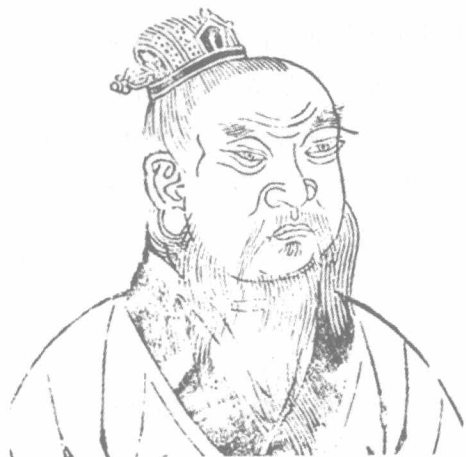
刘邦，中国历史上成王成帝的草根代表

沛县在淮河之北，古泗水之西，地处黄淮平原的中部，境内地势平坦，西南高东北低，古来多沼泽湿地。刘邦出生的丰邑，是沛县所属的乡，为城镇型聚落。