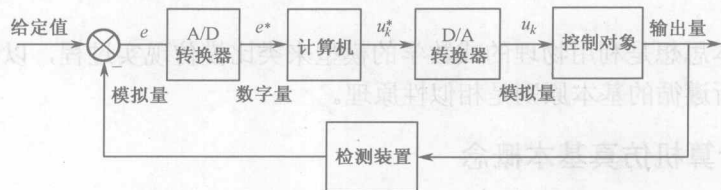
图 1.4 采样数字控制系统结构示意图

离散系统的主要特点是: 在系统中使用脉冲开关或采样开关, 将连续信号转变为离散信号。通常对以离散信号取脉冲形式的系统, 称为脉冲控制系统; 而对于采样数字计算机或数字控制器, 其离散信号以数字形式传递的系统称为采样数字控制系统。图 1.4 是典型的采样数字控制系统结构示意图。