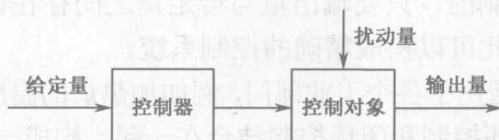
图 1.1 开环控制示意图

如果控制系统的输出量对系统没有控制作用，则这种系统称为开环控制系统。图 1.1 表示了开环控制系统输入量与输出量之间的关系。