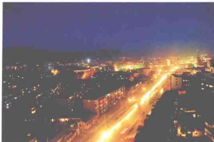
大同煤矿集团矿山夜景

DATONG MEIKUANG JITUAN YOUXIAN ZEREN GONGSI