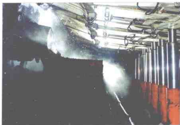
大同煤矿集团综采工作面