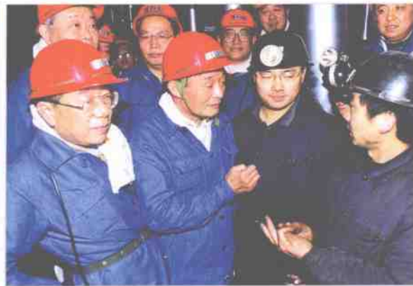
2000 年 10 月吴邦国副总理视察大同煤矿集团