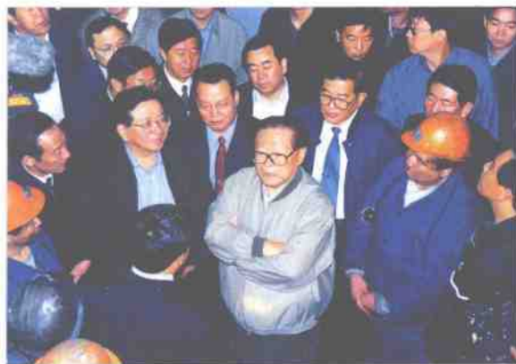
2001 年 8 月江泽民总书记视察大同煤矿集团

大同煤矿集团有限责任公司是全国煤炭行业的特大型企业，512 家国有大中型重点企业之一，1997 年国务院批准列入国家 120 家企业集团试点单位，是山西省 34 家优势企业之一。现有矿井 49 对，职工近 20 万人，总资产 225 亿元，年产销能力近 8000 万 t。从 1949 年成立到 2003 年，共生产煤炭 11 亿 t，上缴利税 142 亿元。