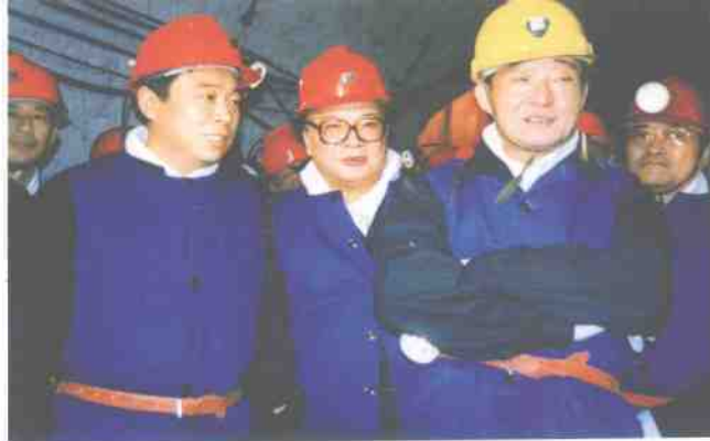
吴邦国委员长视察淮南矿业(集团)公司煤矿