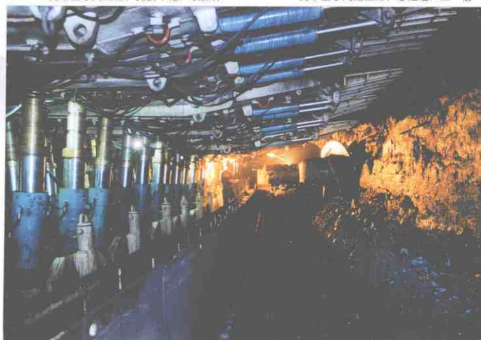
兖矿世界一流综放工作面