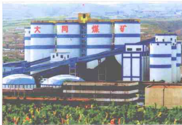
全国一流的晋华宫选煤厂