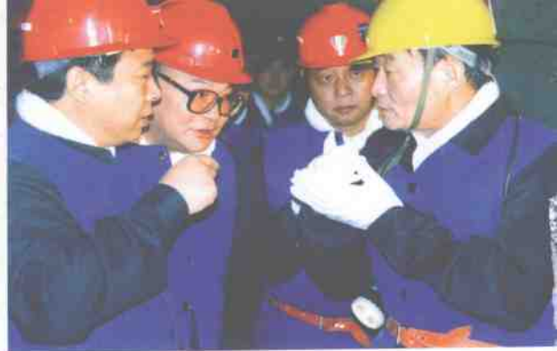
吴邦国委员长详细询问生产情况