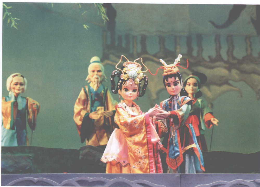
扬州市木偶剧团《琼花仙子》剧照