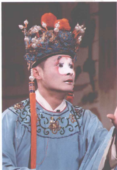
扬州市扬剧团《狸猫换太子》剧照