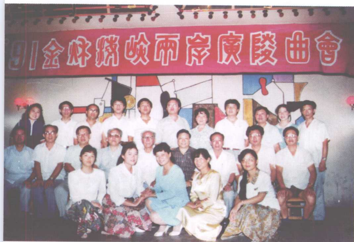
1991年广陵昆曲学社接待台湾学者曾永义等一行的合影