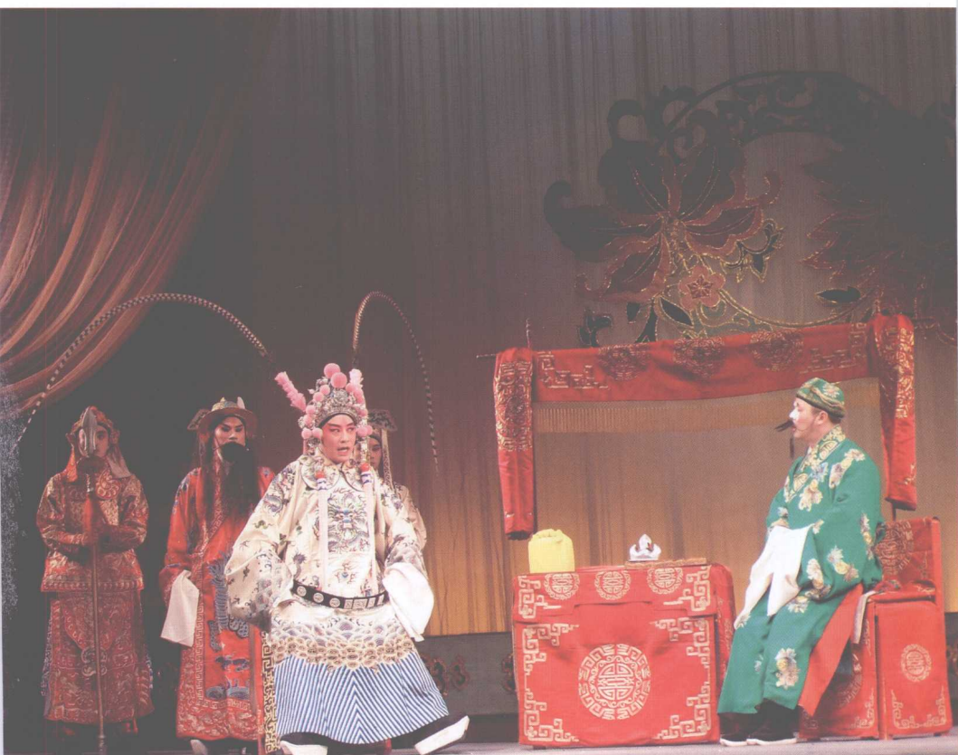
扬州市京剧团《群英会》剧照