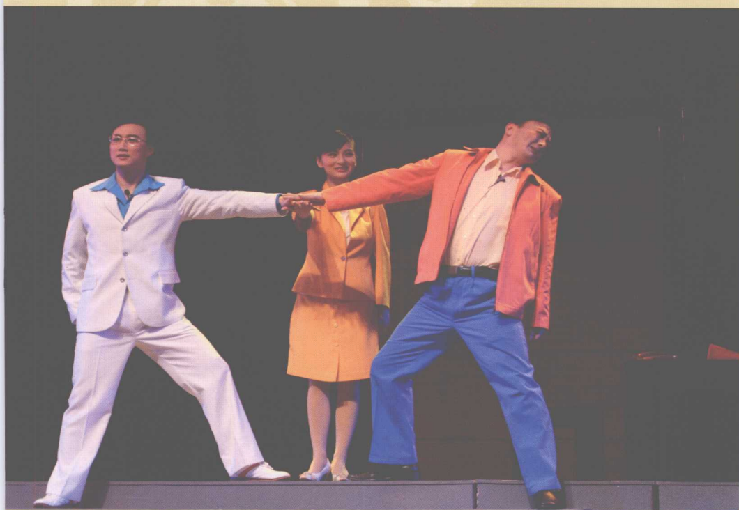
扬州市扬剧团《真假二十四小时》剧照