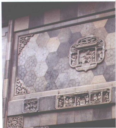
扬州近代盐商卢绍绪住宅门楼戏曲故事砖雕：李白醉酒，高力士脱靴