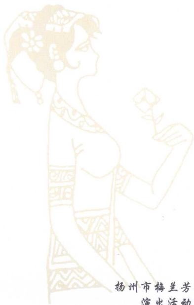
扬州市梅兰芳研究会 演出活动宣传单