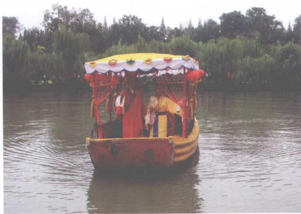
2007 年秋，扬州瘦西湖上的扬剧游船