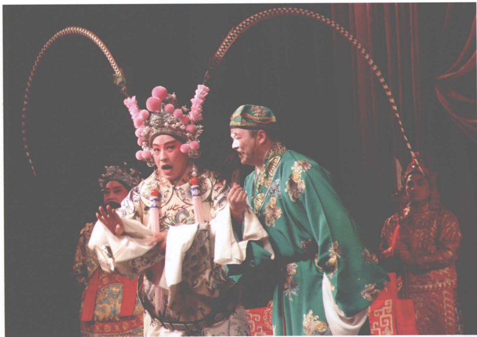
扬州市京剧团《群英会》剧照