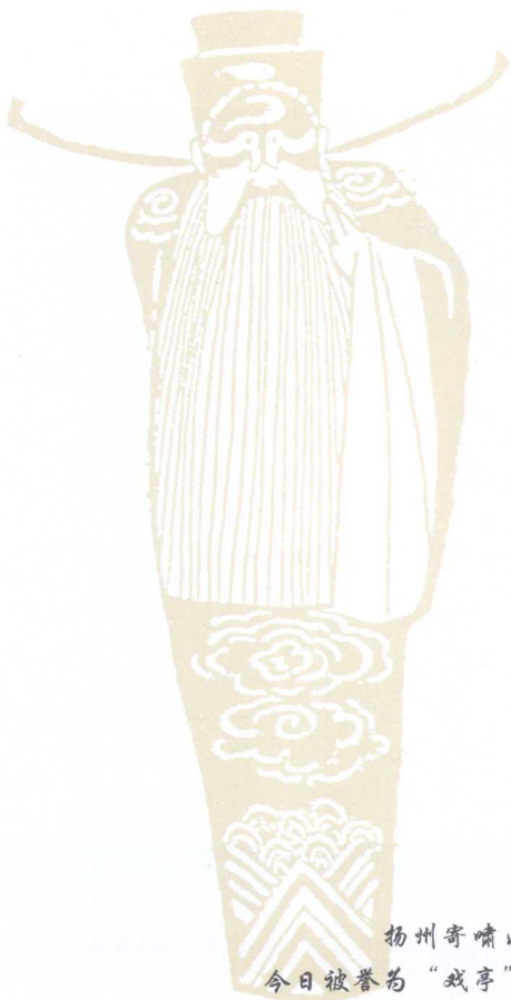
扬州寄啸山庄之水心亭，今日被誉为“戏亭”，最适合拍曲