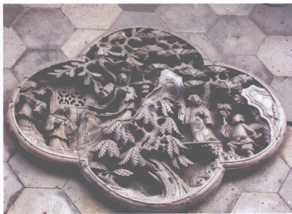
扬州市彩衣街30号大门戏剧人物砖雕：八仙