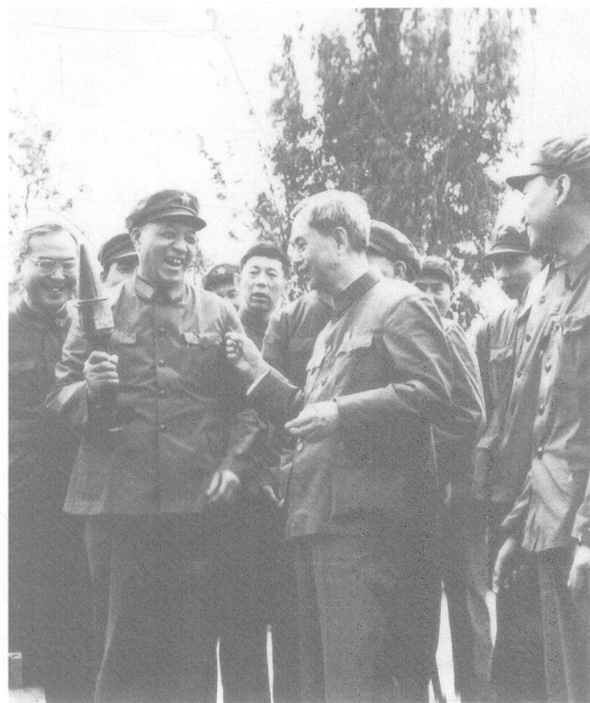
1979年3月，王建安（前左一）与方毅（前左二）率中央慰问团，赴云南前线慰问参战部队官兵。