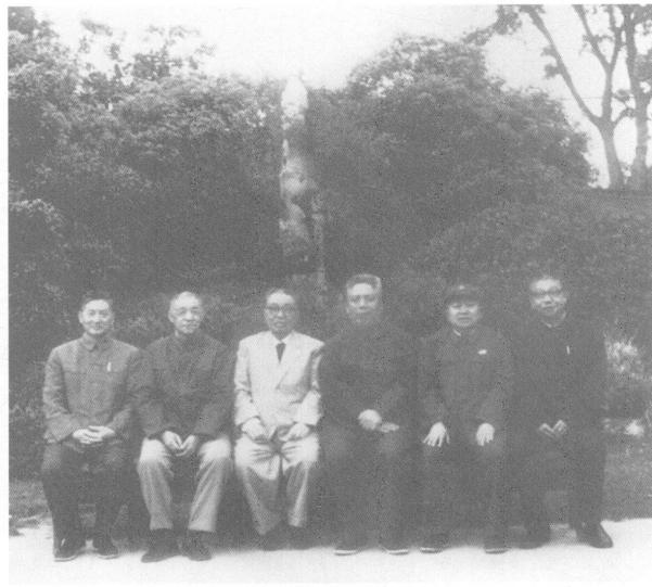
1979年4月，在杭州解放30周年之际，王建安（右二）与谭震林（左三）、铁瑛（左四）等于杭州西湖国宾馆水竹居前合影。