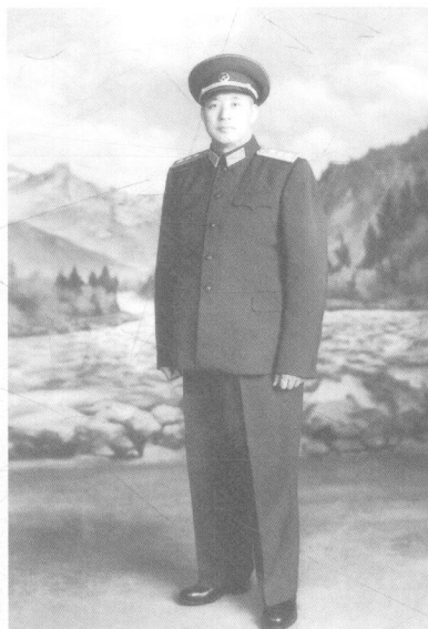
1957年，在沈阳军区的王建安。