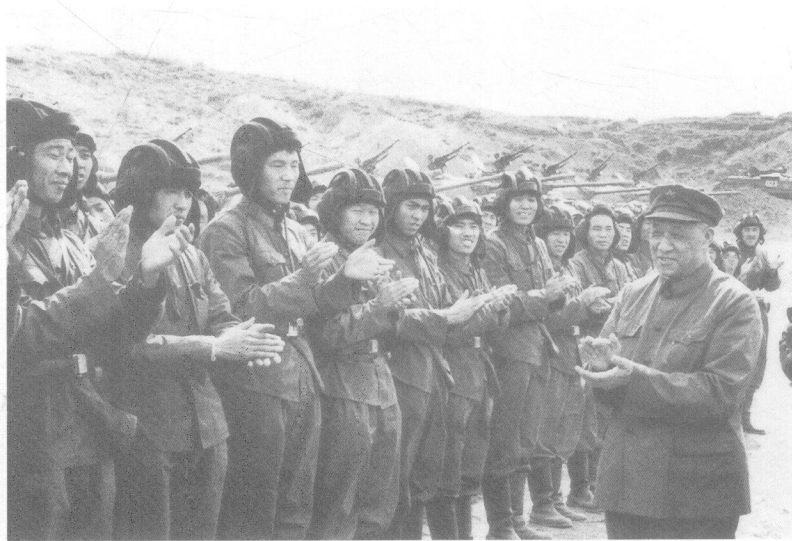
1979年3月，王建安（右一）率中央慰问团在云南前线看望参战部队官兵。