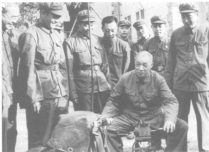
1979年3月，王建安（坐者）率中央慰问团到云南视察某部通信连后，饶有兴致地亲自上机操作。