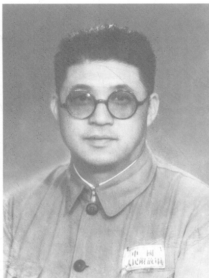
1949年9月，王建安被选为中国人民政治协商会议第一届代表。