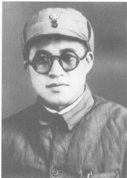
1946年,在鲁中军区的王建安。