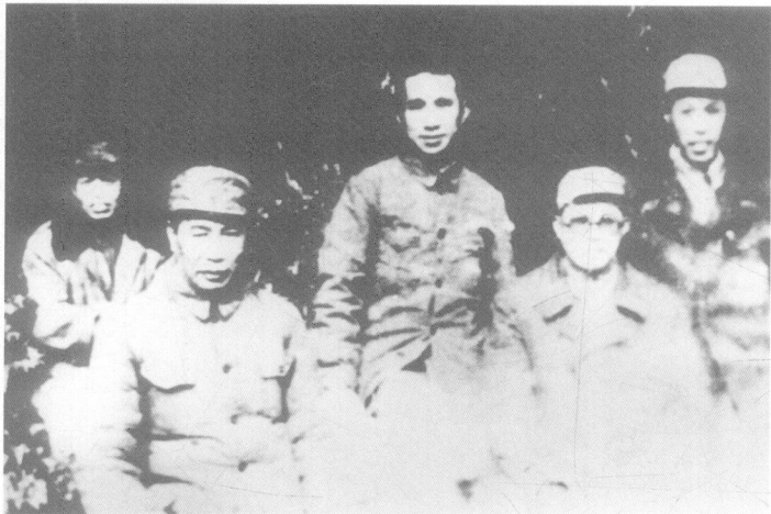
淮海战役期间,王建安与指挥围歼黄百韬兵团的华东野战军部分领导合影。左起:谭震林、陈士榘、粟裕、王建安、谢有法。