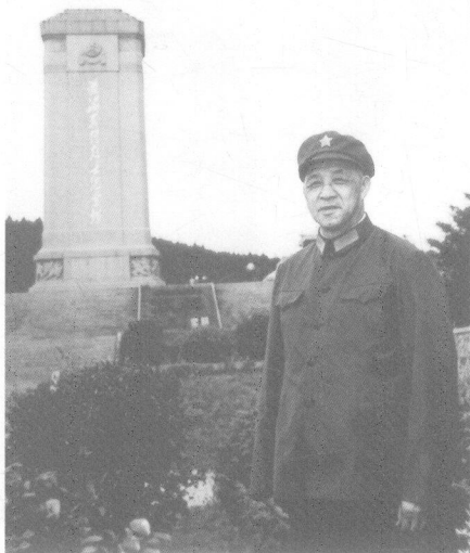
1974年，王建安重访淮海战场，在“淮海战役烈士纪念塔”前留影。