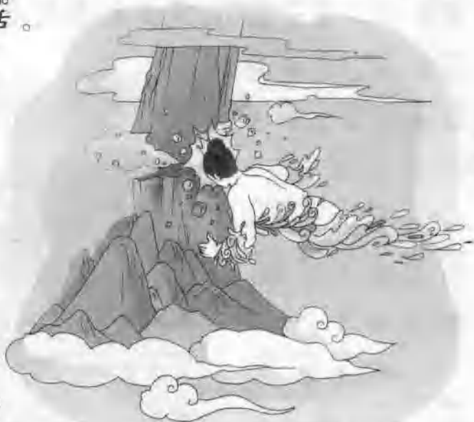
水神一头撞向不周山。

zài shì jiān le jiù yì tóu xiàng bù zhōu shān zhuàng qù zhè yì zhuàng zhěng ge tiān 在世间了，就一头向不周山撞去。这一撞，整个天