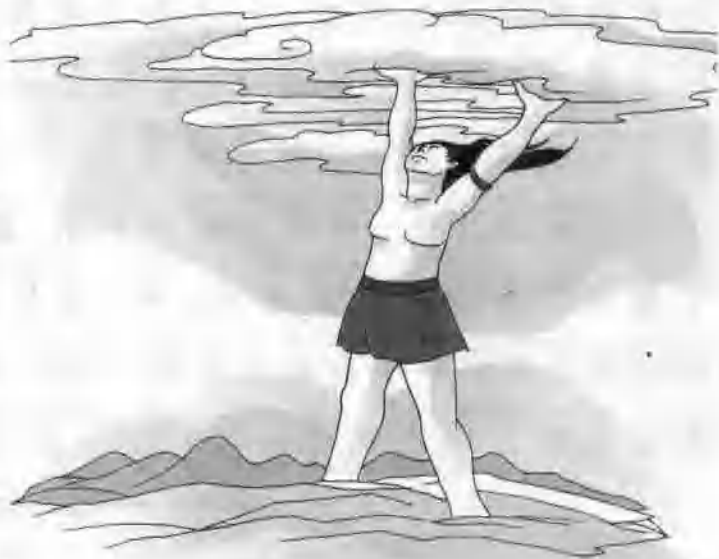
盘古用力撑起了天空。

duō nián de nǔ lì , pán gǔ biàn chéng le yì wèi dǐng tiān lì dì de jù rén , ér 多年的努力，盘古变成了一位顶天立地的巨人，而