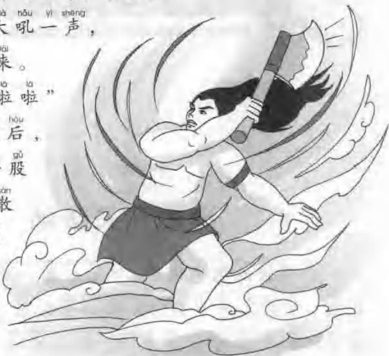
盘古用巨斧劈开了天地。