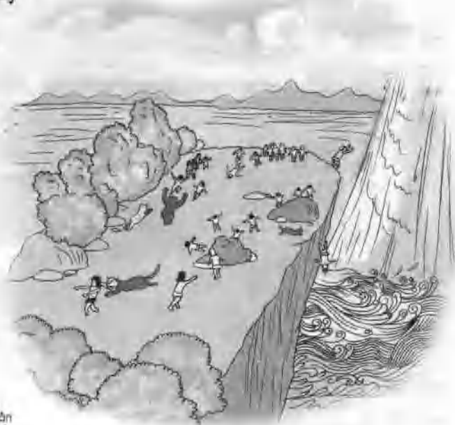
天河的水顺着漏洞倾泻下来。

de dān fù qǐ bǔ tiān de zhòng rén 地担负起补天的重任。