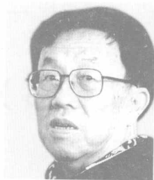
中国作家协会副主席 ——王蒙

“方洲新概念”图书10年来一直得到了全国一些知名作家的指导，拥有顶级的作家顾问团。