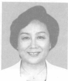
中国家庭教育专家 “知心姐姐” ——卢勤