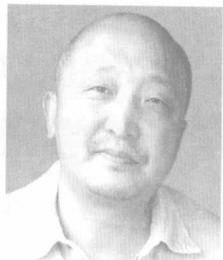
北京作家协会主席 ——刘恒