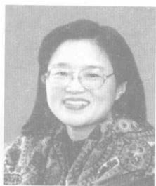
著名儿童文学作家 ——秦文君