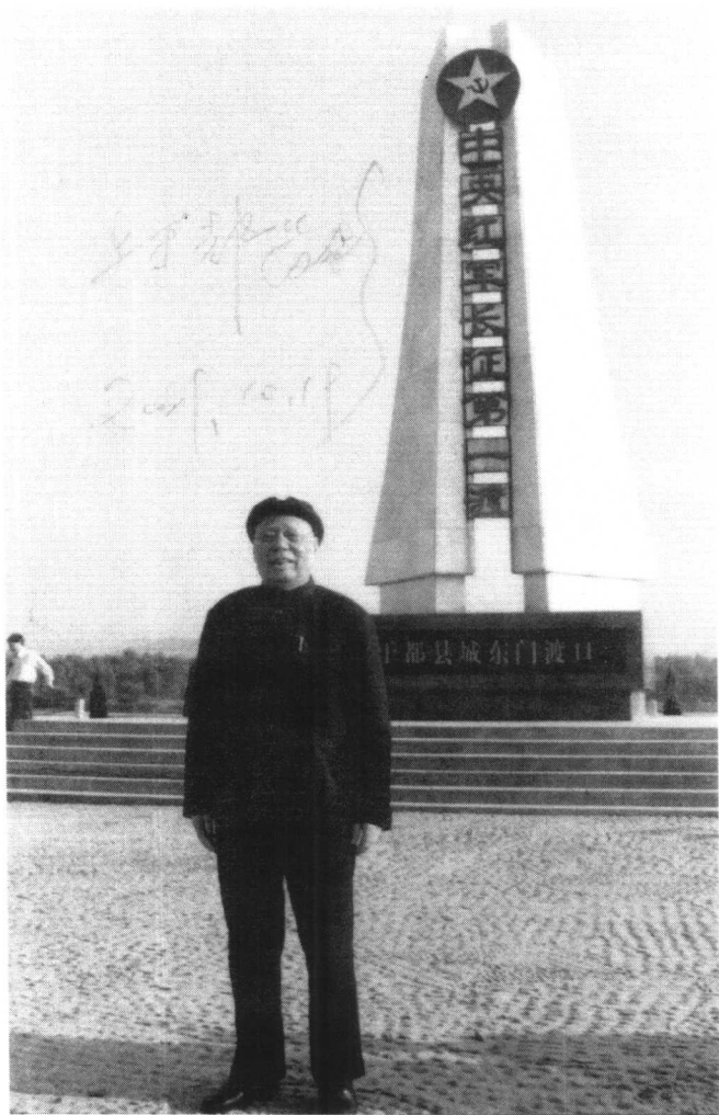
2001年10月19日作者摄于江西于都县 中央红军长征第一渡