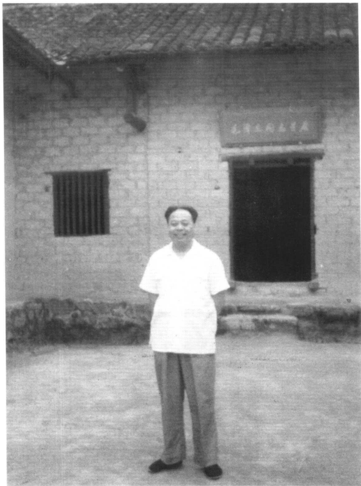
1966年6月作者在韶山毛泽东同志故居