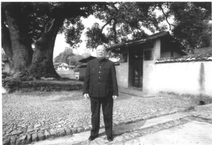
2001年10月摄于江西端金毛主席住地大门口， 这是作者1933年参加红军站第一班哨的地点