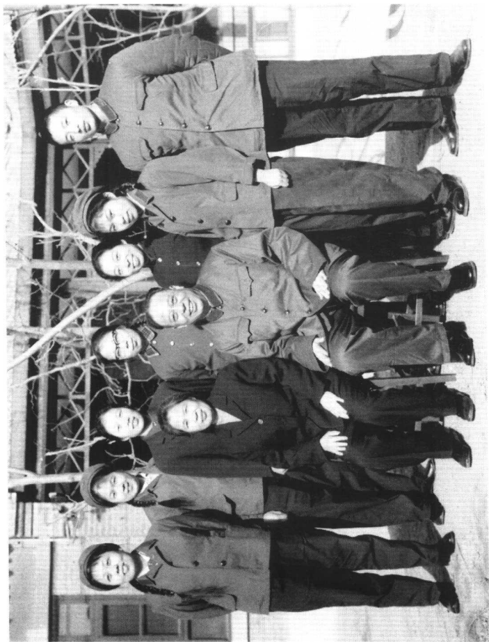
1973年作者全家福(摄于中南海)