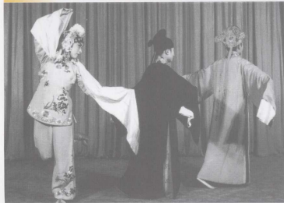
《放裴》中的影角 (穿黑衣者)