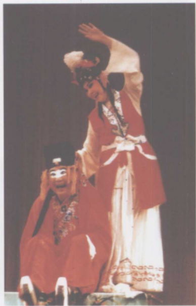
《活捉三郎》中的提火巴人