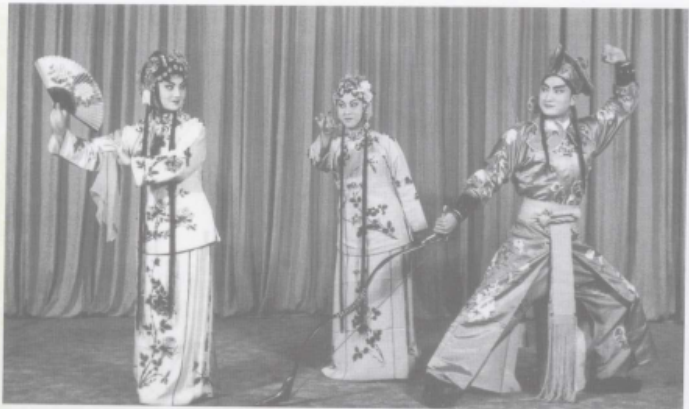
《射雕》中的眼中情丝