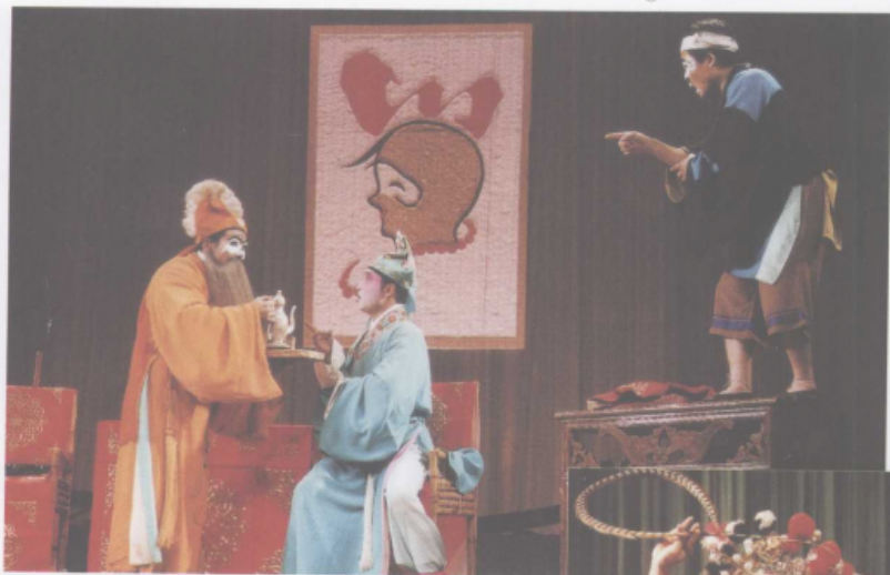
《黄沙渡》中的搭飞白