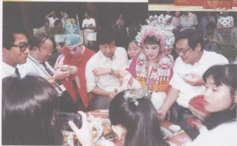
目连戏中的戏中餐