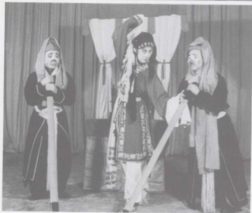
《打神》中真人饰演的泥塑皂隶