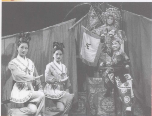
《桂英打雁》中的升帐