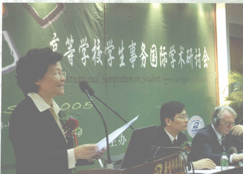
11月5日，我校举行高等学校学生事务国际学术研讨会