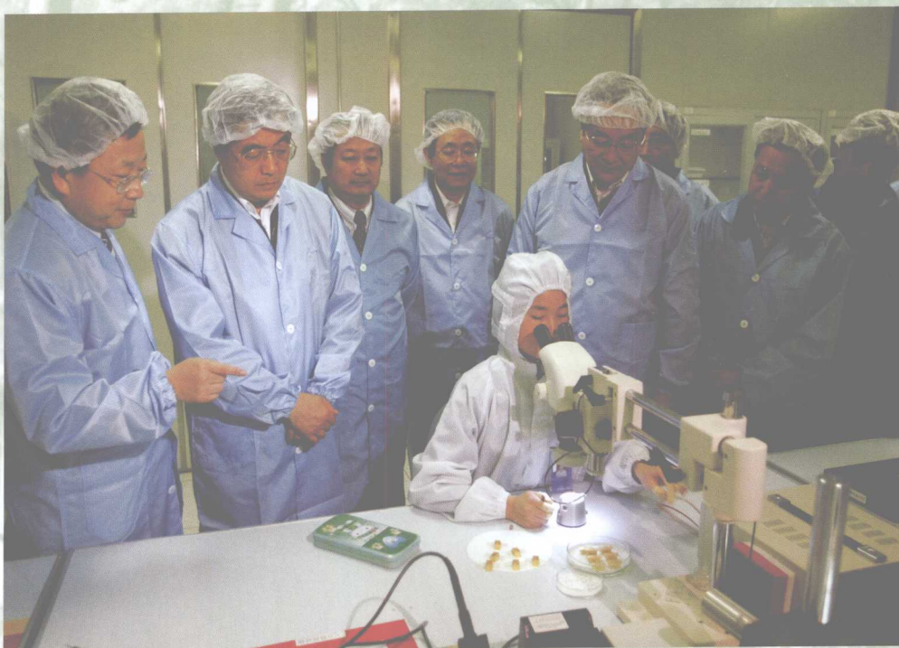
8月23日，中共中央总书记胡锦涛来我校视察