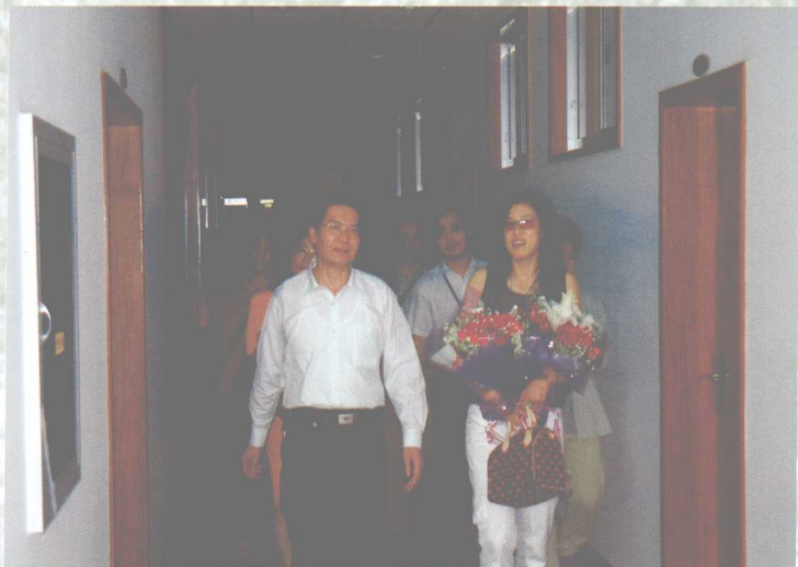
我校公共管理学院学生、羽毛球奥运冠军高峻在校领导陪同下参观校园