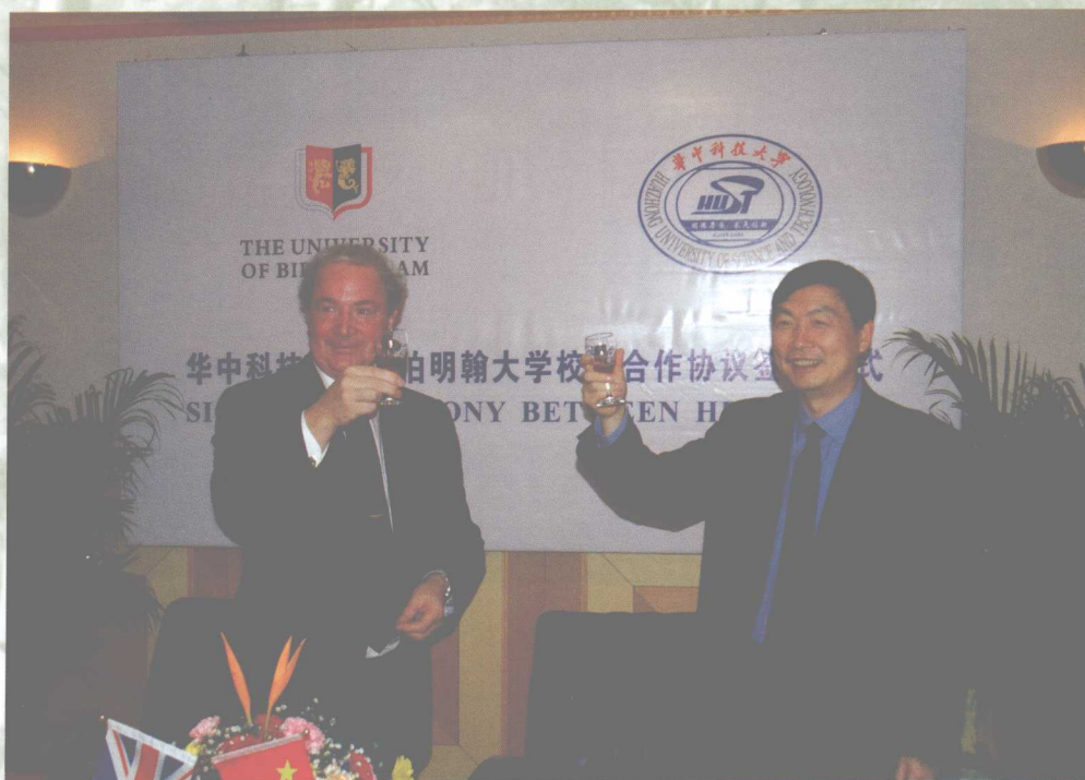
我校与英国伯明翰大学签订合作协议