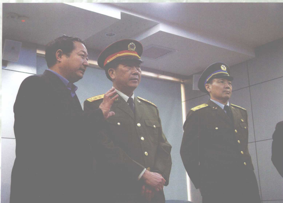
4月14日，广州军区副司令员、军区国防动员委员会常务副主任欧金谷中将一行来我校考察