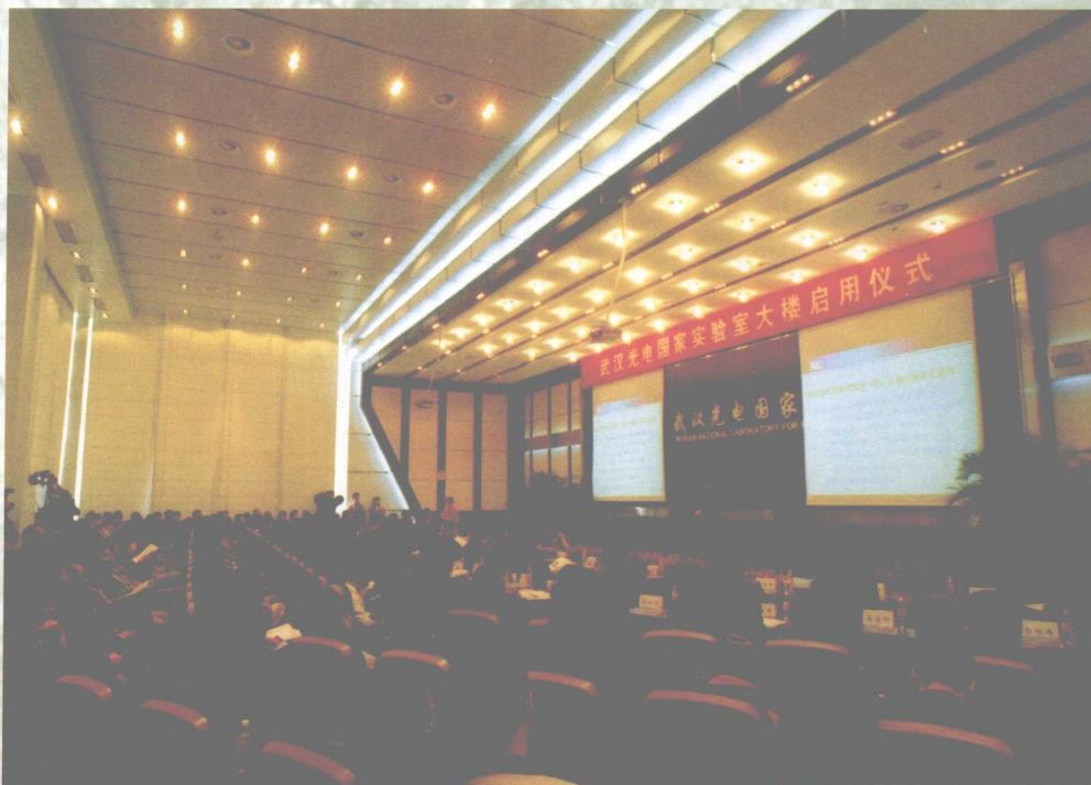
11月2日，武汉光电国家实验室（筹）大楼启用仪式