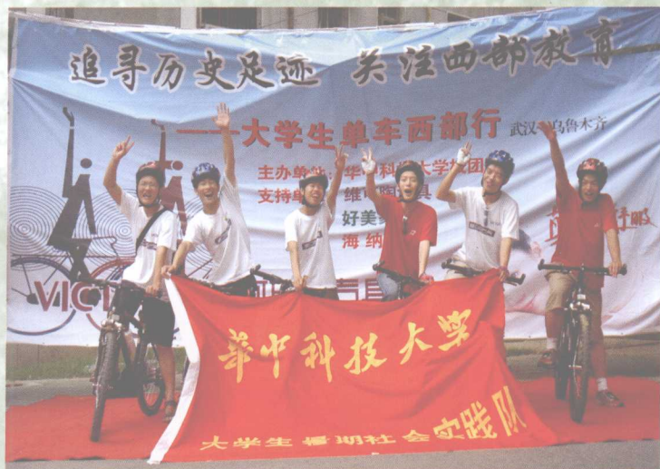
大学生暑期社会实践单车西部行活动举行出征仪式