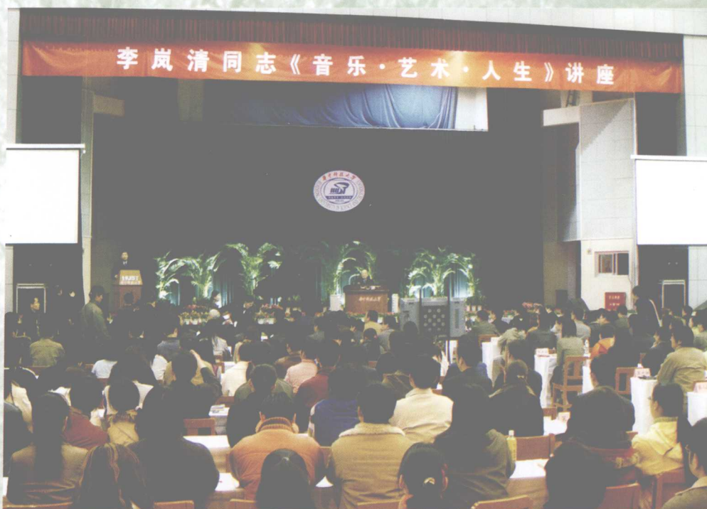
3月23日，原中共中央政治局常委、国务院副总理李岚清来我校举办《音乐·艺术·人生》讲座