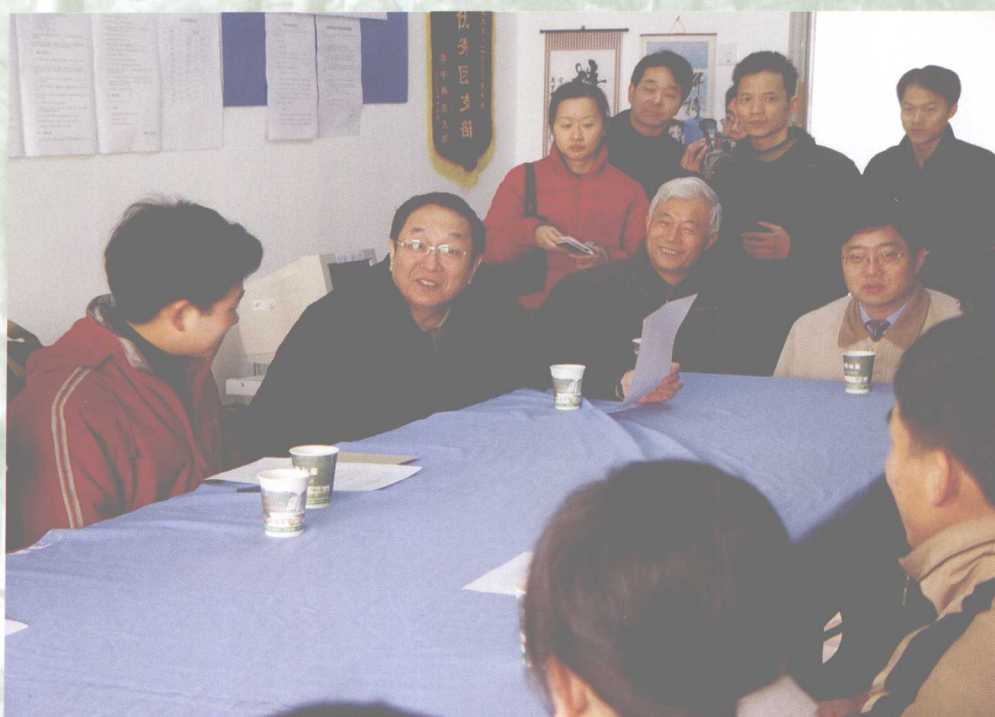
2月1日，中共中央政治局委员、湖北省委书记俞正声到校看望寒假留校的学子