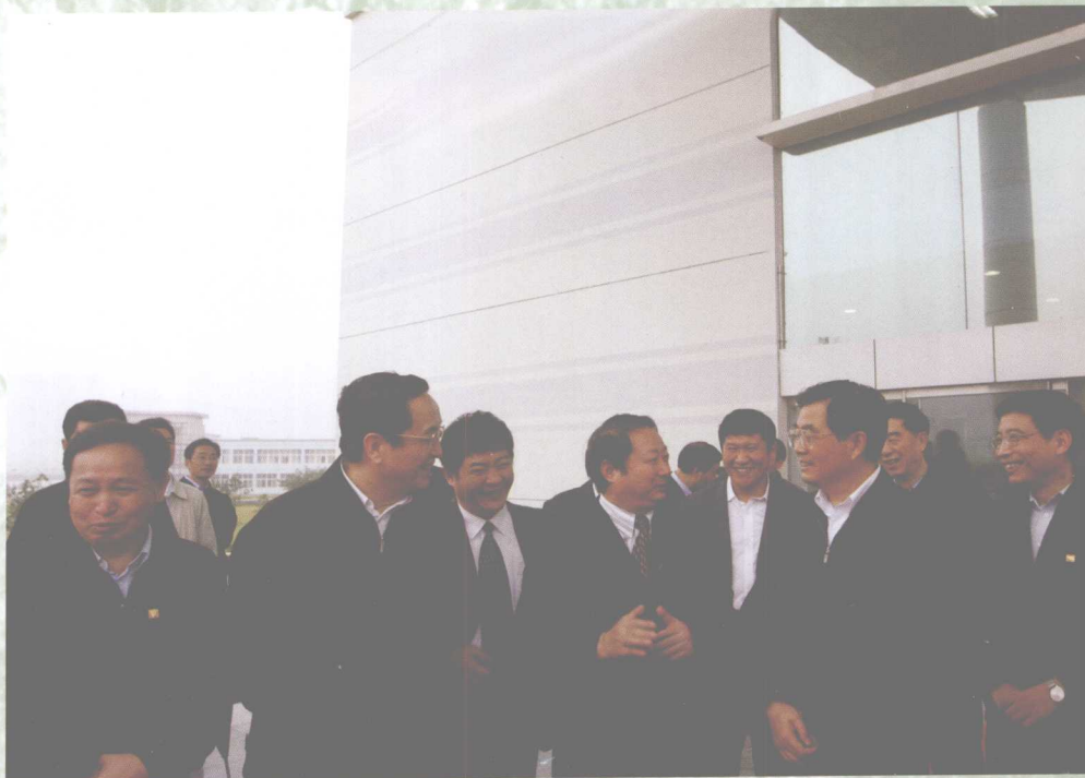
8月23日，中共中央总书记胡锦涛来我校视察