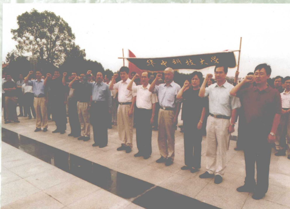
8月20日，我校党政领导班子专程赴红安县接受革命传统教育，重温入党誓词