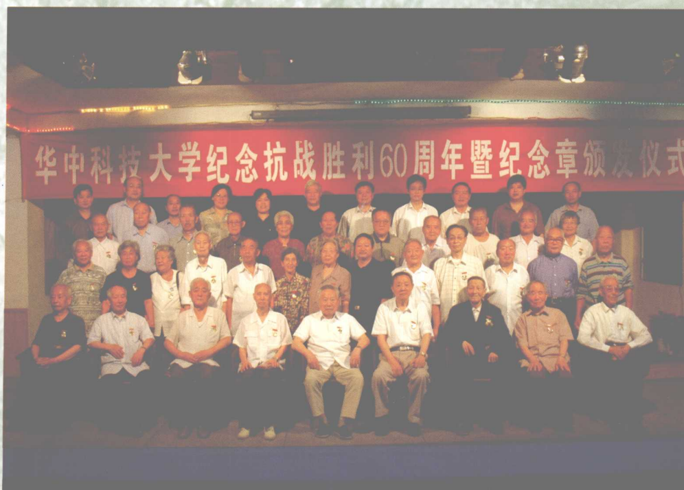
9月1日，学校纪念抗战胜利60周年暨纪念章颁发仪式在老年活动中心隆重举行