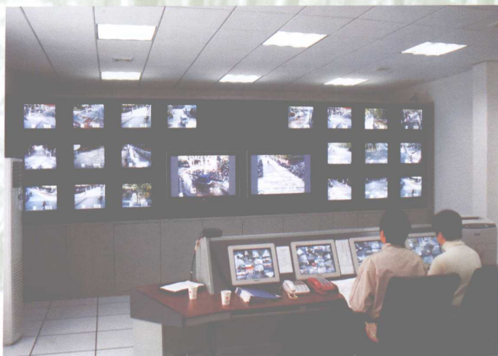
我校校园治安视频监控系统工程投入使用