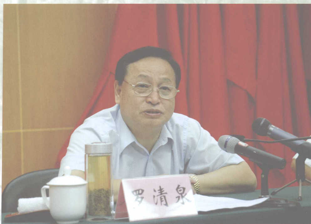
8月30日，湖北省省长罗清泉为我校师生员工工作形势报告