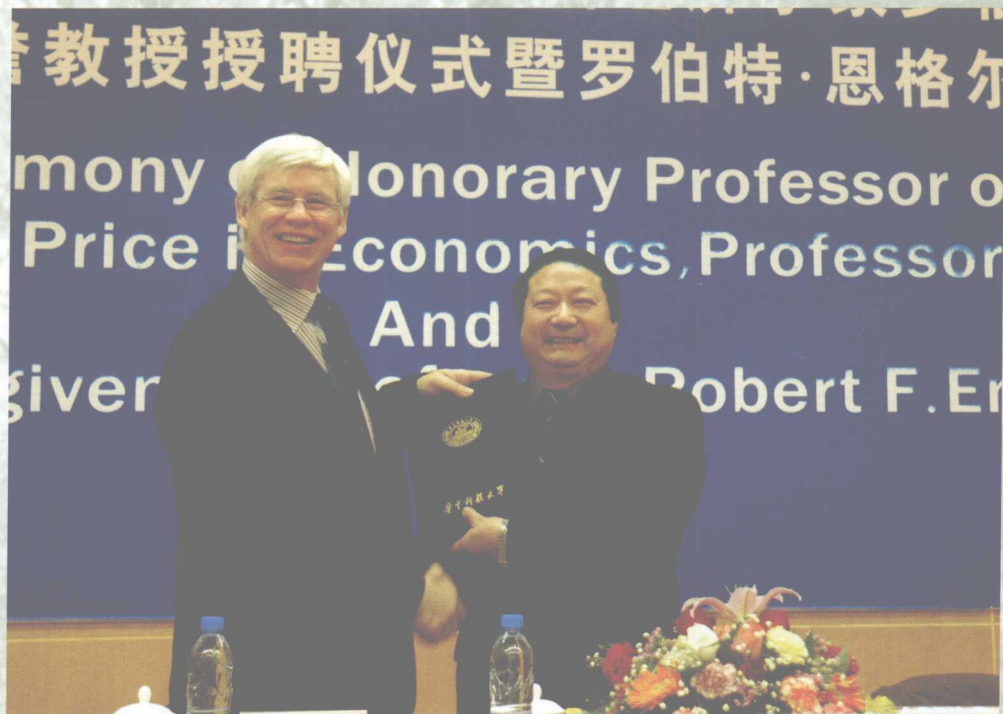
诺贝尔经济学奖获得者罗伯特·恩格尔教授到我校讲学并受聘为我校名誉教授