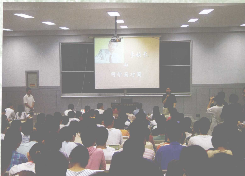
校长李培根院士与学生面对面座谈