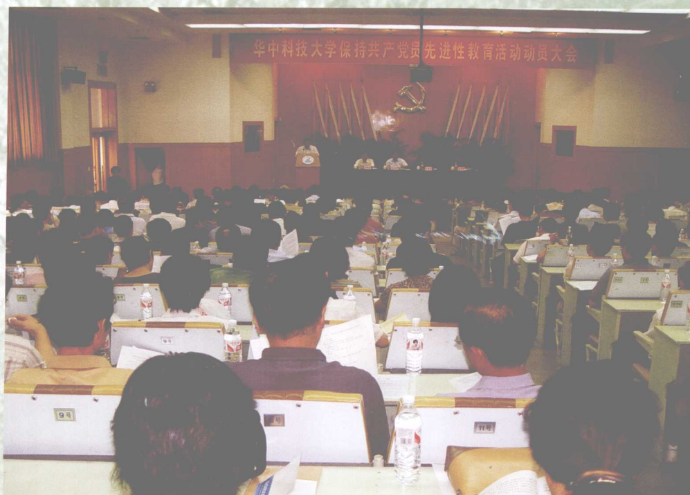
7月20日，我校隆重召开保持共产党员先进性教育活动动员大会