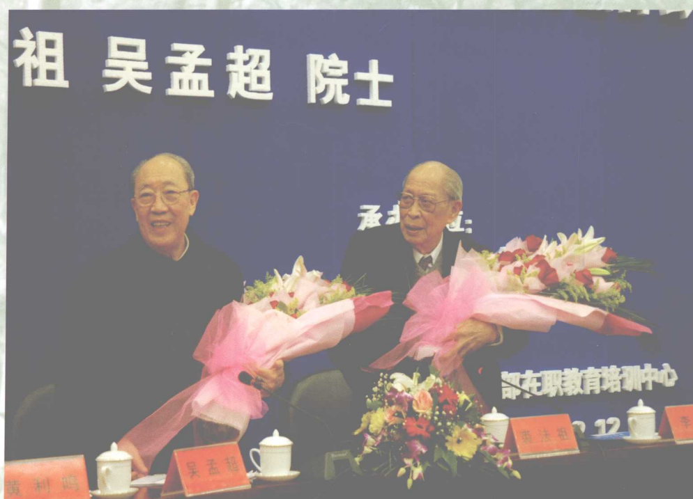
12月12日，我校裘法祖院士参加了由中央电视台等单位举办的“2005医学大家校园行”活动。图为裘法祖院士、吴孟超院士出席在我校举办的“医学大家校园行”活动