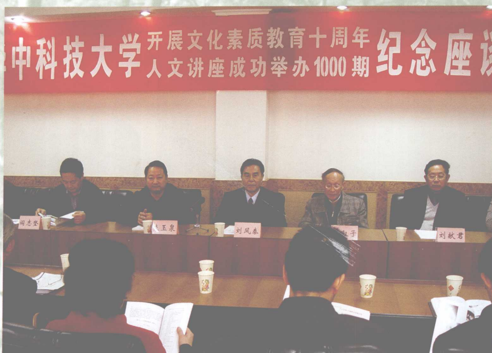
11月17日，我校举办“开展文化素质教育十周年”纪念座谈会。截至11月，我校共举办1000期人文讲座