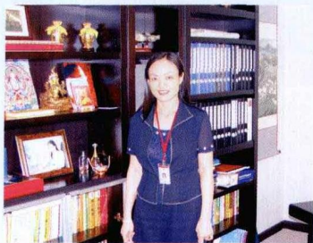
中诗 · 林桃