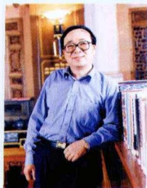
青瓷博物馆 · 吴克顺