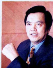
冠日 · 肖首清