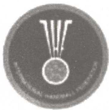
国际手球联合会会徽

国际手球联合会 (IHF) 成立至今已走过近60年的历程, 期间经历了诸多坎坷, 国际