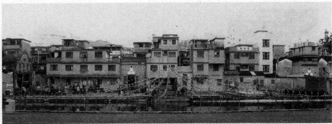
图一 洪朝时的粉岭围正围全景

粉岭围太平洪朝的仪式主要在粉岭围正围门与鱼塘之间的空地进行。届时,在这块空地上,要搭建神棚、歌台,还要临时布置天阶、法桥等,供洪朝用。