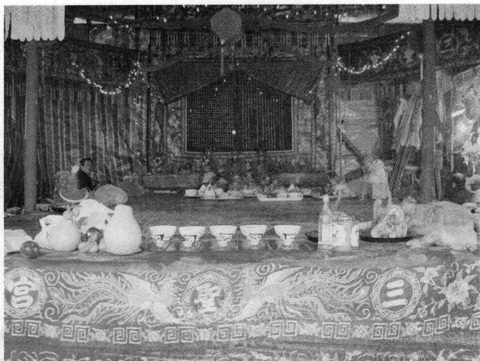
图四 神棚供台(右端供有一只朝猪)

围帘以紫色丝绒制成,共有3块,分别挂在神台上方的左右两侧和供台前面的上方。其中挂于神台上方左右两侧的各1块,都有金色丝线绣的“三圣宫”3个大字,并写有捐制者的姓名;挂在供台前面上方的1块则有以金色丝线绣的“神人共舞”4个大字,也写有捐制者的姓名。