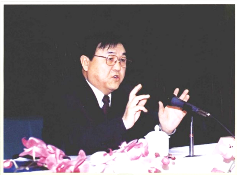
本书作者在全省林业工作会议上讲话