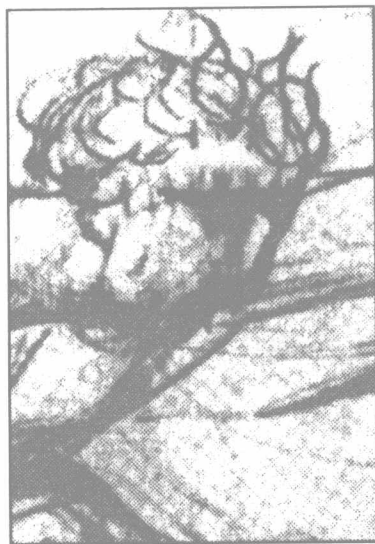
降凡的天使:但丁《神曲》插曲。 威廉·布莱克,1826年 (皮尔庞特·摩根图书馆,纽约)