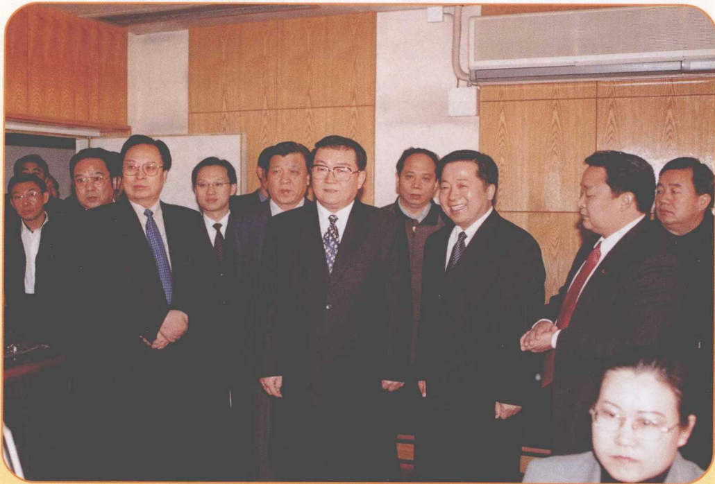
2002年12月11日，中共中央政治局常委李长春，中共中央政治局委员、中央书记处书记、中宣部部长刘云山视察中央电台