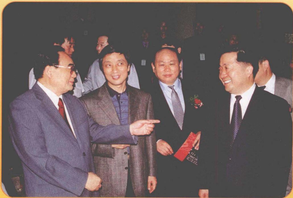
第十五届中共中央政治局委员、中央书记处书记，时任中宣部部长的丁关根(左一)在出席中央电台主办的“中华神韵”晚会时与中央电台台长杨波(右一)、中央电视台台长赵化勇(左二)、国际电台台长李丹(右二)交谈