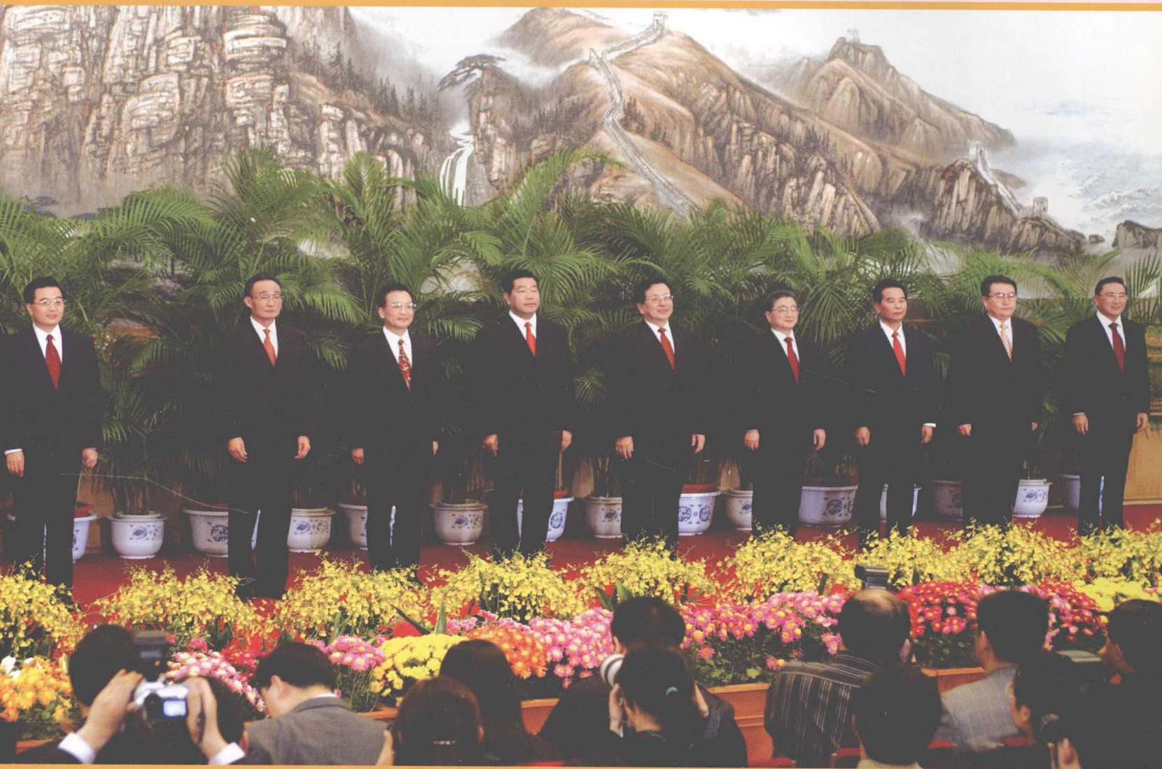
2002年11月15日，中央三台现场直播新当选的中共中央总书记胡锦涛和中央政治局常委吴邦国、温家宝、贾庆林、曾庆红、黄菊、吴官正、李长春、罗干在人民大会堂与采访中共第十六次全国代表大会的中外记者见面并回答记者的提问。