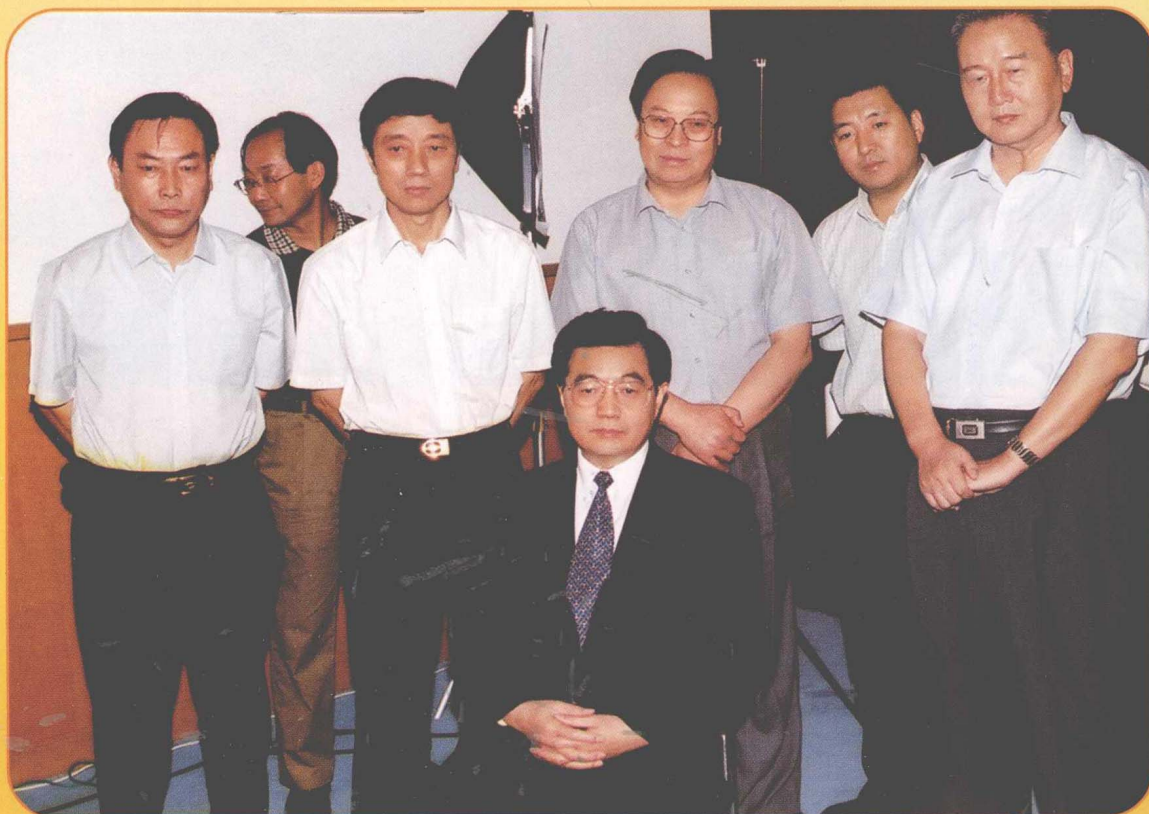
2002年8月27日，中共中央政治局常委、国家副主席胡锦涛接受中央电视台记者采访后审看录像