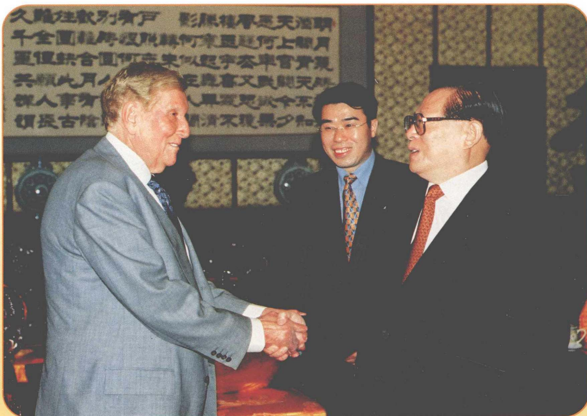
2002年7月31日江泽民主席会见美国维亚康姆公司董事长兼首席执行官雷石东