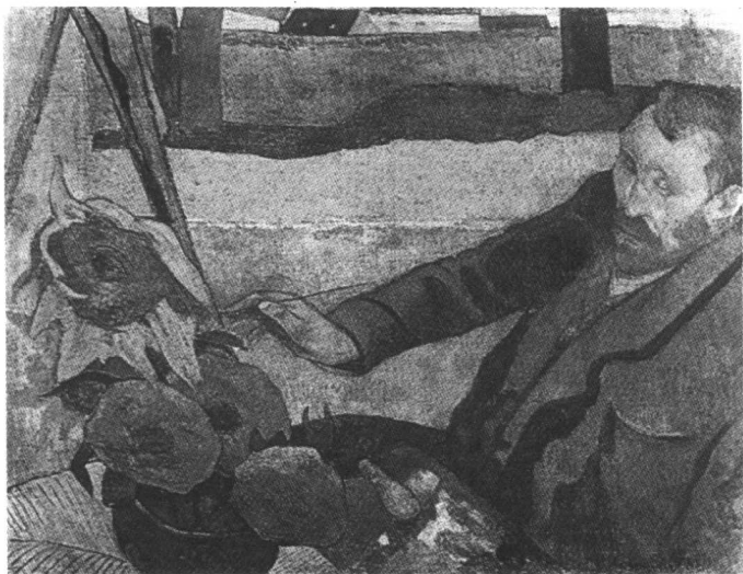
图1 凡·高在画室 1888年 高更画者在 创作中是否预设与他 人进行信息传递?

又是什么？假如我们可以知道艺术的本质是什么，那么这个问题迎刃而解。我们可以通过对于本质的把握来领会会共同的对于美的感悟。但是艺术的本质从来都没有一个确切的答案，这样的问题从苏格拉底时代就开始思考，前人已经提出了各种各样的回答，而且接着他们的思考，我们仍可以继续回答下去。在前人已经提出的所有回答中，任何一种都不是没有道理，但是任何一种也并不是全有道理，我们即使将所有的解释加在一起也还无法说明什么是艺术。所以，向哲学自身研究的困境一样，发现艺术的本质也应该是一个被暂时搁置的问题，而通过其他方式去建构艺术创作者与欣赏者之间的交流的关系。