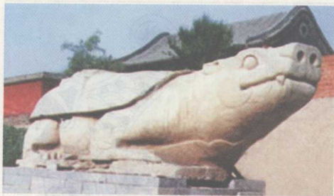
赑屃残碑基座，河北正定出土。

由于龙之九子有诸多不同说法，因而细数起来，列在龙子名下的就不只是“九”了，数目要远多于此；而且关于它们的“所好”，因异名而略有出入。其中，影响较大而常见的，有如下这些：