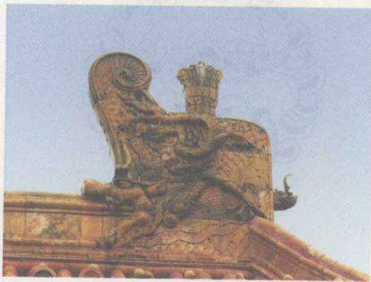
北京故宫太和殿鸱吻

蒲牢： 形状像龙，但比较小。性喜吼叫，所以做了大钟的钮。相传蒲牢生活在海边，平生最怕海里的鲸鱼，每当遇到鲸鱼袭击时，就要大吼大叫。后来人们就把大钟的钮铸成蒲牢的形状，而且用雕刻成鲸鱼形状的木杠撞钟，俗说可以使钟声洪亮、远传千里。由此，蒲牢也成了钟的代称。此外，古代的编钟钮也装饰着蒲牢，用意与钟钮一致，但人们的愿望是清脆、悦耳，而非只响亮。