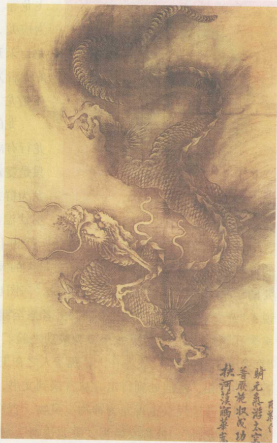
云龙图。南宋陈容绘。

其实，龙不过是一个杂凑的象征性动物，只存在于观念之中。关于龙的形象，古代有“三停九似”说。南宋罗愿《尔雅翼》引用汉人王符的话说：“王符曰世俗常画马首蛇身以为龙，实则有三停九似说。谓自首至膊，膊至腰，腰至尾，皆相停（均匀相等）也。九似者，角似鹿，头似驼，眼似兔，项似蛇，腹似蜃，鳞似鱼，爪似鹰，掌似虎，耳似牛。”此外，龙能变化。《说文解字》说：“龙，鳞虫之长，能幽能明，能细能巨，能短能长。春分而升天，秋分而潜渊。”有的典籍所描述的龙的特异之处更加突出，它不仅是鳞虫之长，而俨然动物始祖。《淮南子·地形训》说：