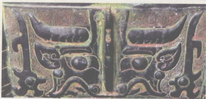
商周青铜器 上的饕餮纹