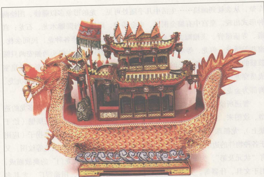
龙船彩灯。苏州手工艺品。