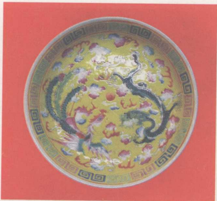
民国龙凤呈祥纹盘

羽嘉生飞龙，飞龙生凤凰，凤凰生鸾鸟，鸾鸟生庶鸟，凡羽者生于庶鸟。毛犊生应龙，应龙生建马，建马生麒麟，麒麟生庶兽，凡毛者生于庶兽。介鳞生蛟龙，蛟龙生鲲鹏，鲲鹏生建邪，建邪生庶鱼，凡鳞者生于庶鱼，介潭生先龙，先龙生玄鼈，玄鼈生灵龟，灵龟生庶龟，凡介者生于庶龟。”由此又可以知道龙的种类