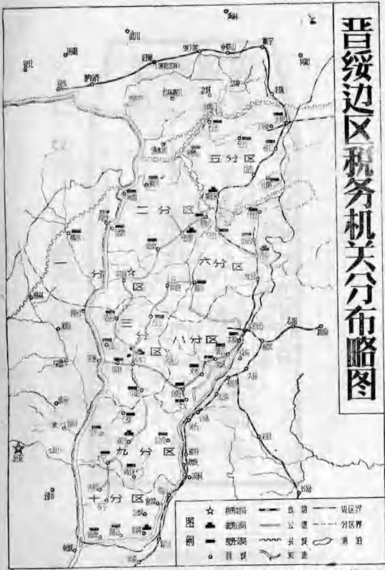
晋绥边区税务机关分布略图，是按晋绥边区税务总局1947年绘的草图复制的。