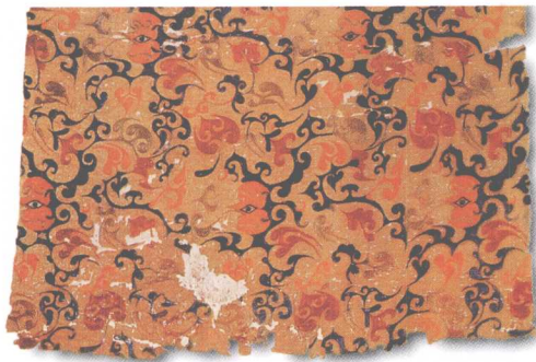
乘云绣黄绮 辫子股绣 马王堆汉墓出土