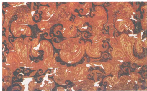
长寿绣绛红绢 辫子股绣 马王堆汉墓出土