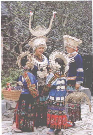
苗族服饰 贵州雷山