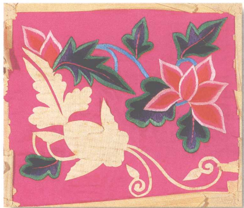
吉林满族枕顶刺绣的剪纸花样

刺绣工艺的表现特质取决于针法的选择与运用。在刺绣漫长的发展历史中，针法经历了由简单到丰富