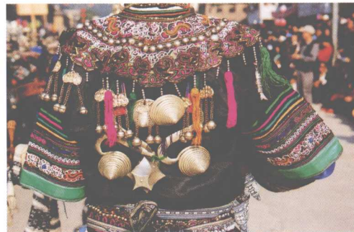
侗族服饰 贵州黎平