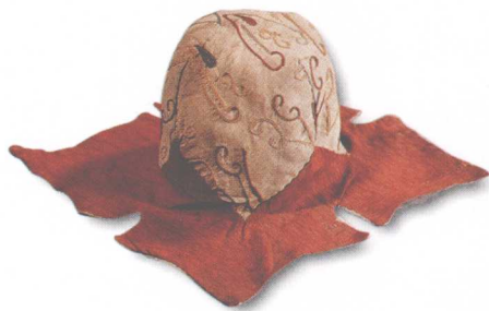
云纹粉袋 辫子股绣 东汉