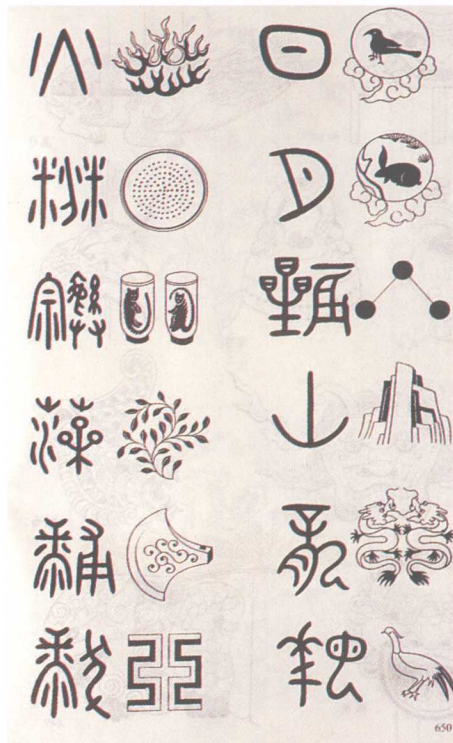
天子衮服 十二章纹

河南安阳商代妇好墓出土的铜觶上，黏附有菱形纹样的绣迹，针法为辫子股，这是迄今发现的最早的刺绣印迹。湖北江陵马山楚墓出土的对凤对龙纹刺绣、龙凤虎纹刺绣残片，湖南长沙马王堆汉墓出土的信期绣、乘云绣、长寿绣等精美的刺绣，以实物佐证了春