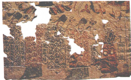
供养人绣像 辫子股绣 北魏 敦煌莫高窟出土