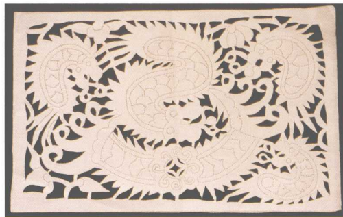
贵州苗族衣袖的剪纸刺绣花样