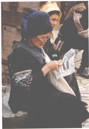
绣花的苗族妇女 贵州雷山

消灾避邪是老百姓生存的基本需求。“神虎镇宅”“钟馗捉鬼”“五毒驱邪”都是民间刺绣的重要题材。虎是百兽之王，有镇宅驱邪，消灾降福的神力。虎纹常用于装饰儿童用品，如“虎头帽”、“虎鞋”、“虎枕”等。民间绣品中常见的题材“骑虎娃娃”、“娃戏虎”，无非是借虎威驱除邪气，护佑孩童与家庭。农历五月初五端午节这天，民间习俗要给小孩佩带精心绣制的五毒香包，穿五毒背心及五毒肚兜。“五毒”为蛇、壁虎、蟾蜍、蜘蛛、蝎子，取其以毒攻毒之意。