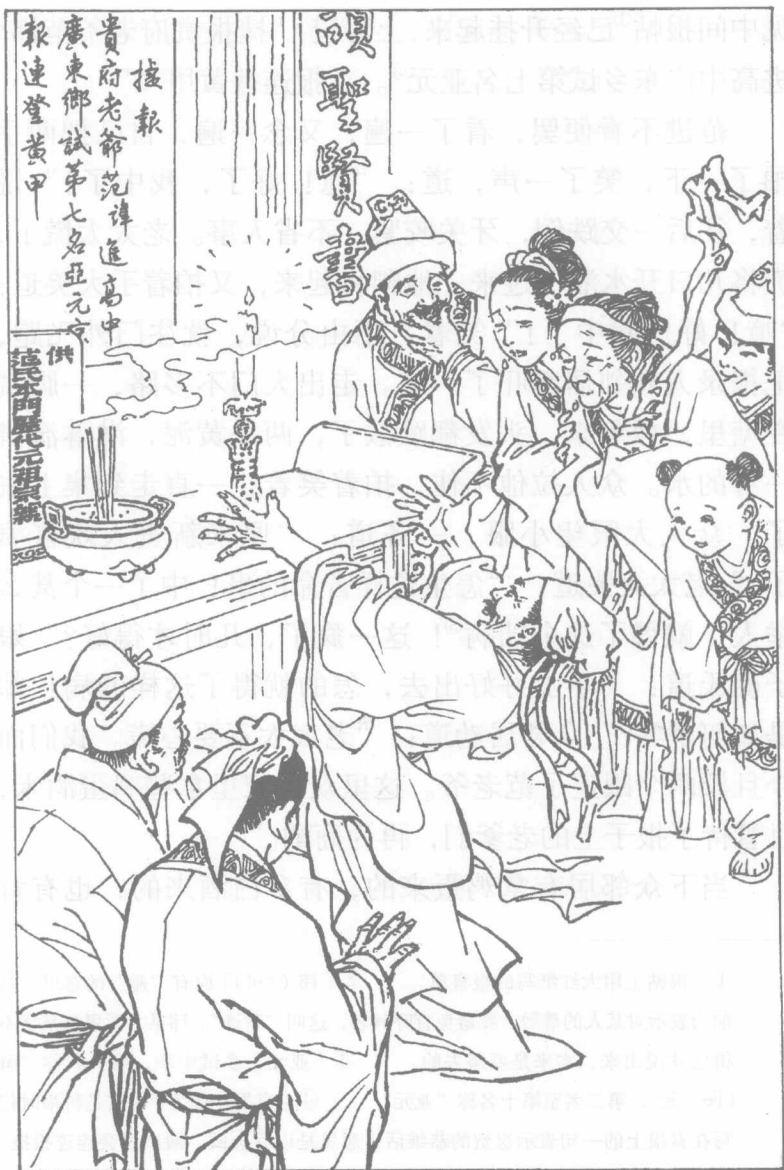
中间报帖已经升挂起来