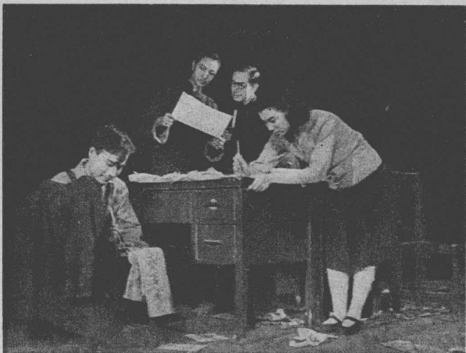
迎 接 解 放