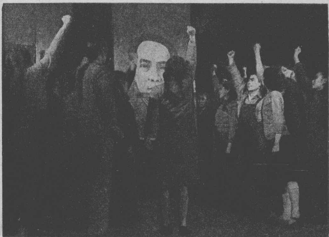
毛 主 席 萬 歲