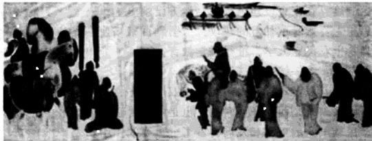
张骞拜别汉武帝出使西域

(5)西域都护的设立：公元前60年，西汉政府设立，总管西域事务。西域都护的设置，标志着今新疆地区开始隶属中央政府的管辖，成为我国不可分割的一部分。