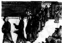
唐太宗在端门看见新科进士鱼贯而出，高兴地说：“天下英雄入吾彀中矣。”

2. 完善 唐朝时，科举制逐渐完善。扩充国学规模，扩大考生来源，增加考试科目（以进士、明经两科最重要），丰富考试内容，严格考试制度。唐太宗、武则天、唐玄宗是完善科举制的关键人物。