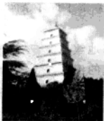
西安的慈恩寺大雁塔，是为保存玄奘带回的佛经而修建的。

3. 鉴真东渡 唐玄宗时，鉴真应日本僧人邀请，东渡日本，至第六次才成功。他在日本十年，辛勤不懈地传播唐朝的文化。他精心设计的唐招提寺，佛殿式样优美，至今犹存，被日本视为艺术明珠。他为促进日本社会的发展及中日文化的交流作出了巨大的贡献。