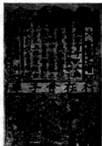
南宋纸币铜版拓片