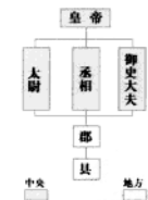
秦政治体制示意图