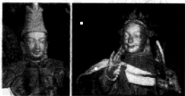
松赞干布与文成公主

(3) “和同为一家”:8世纪初期,金城公主入藏。吐蕃赞普尺带珠丹上书唐朝,表示唐蕃“和同为一家”。