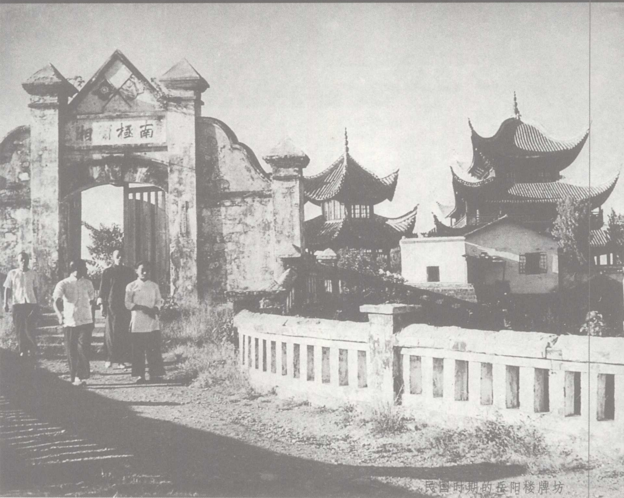
民国时期的岳阳楼牌坊