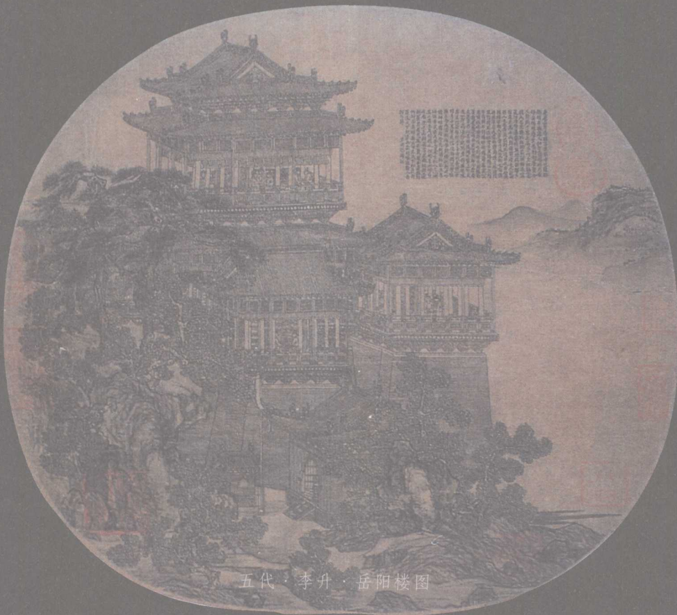
五代·李升·岳阳楼图