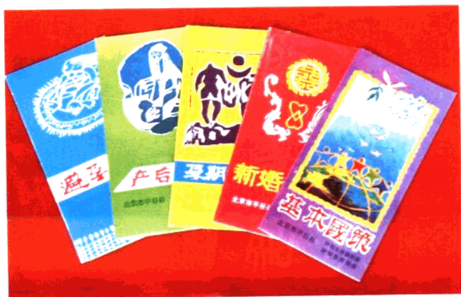
1994年平谷县计生委印制的计划生育宣传品。