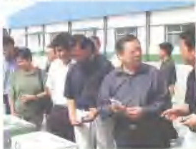
以驻旧金山总领事彭克王、大使雷一为团长的外交部大使参观考察团一行五人，随行的有驻伊拉克大使杨兴林、驻卡拉奇总领事孙春业、驻芝加哥总领事徐尽忠、驻香港总领事孙鹤到我公司参观考察。

国家同类产品首批《食品安全生产许可证》，2004年2月通过了“省免检产品”审核；2004年10月，被评为“山东省第五届消费者满意单位”；2004年11月，“兔巴哥”系列食品被评为“中国著名品牌”。面对荣誉，兔巴哥人将再接再厉，秉承“一流产品，做一流品牌，创百年企业”的经营理念，为消费者提供更多更好的放心、满意产品，创造兔巴哥更加灿烂辉煌的明天。