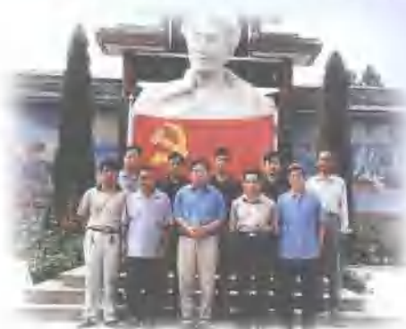
组织党员参观焦裕禄纪念馆

山东华洲建设（集团）公司将始终坚持“以质量求生存，以用户为上帝，以效益促发展”的企业宗旨，以“诚信务实、励精图治、开拓创新、再铸辉煌”的饱满精神，竭诚与各界朋友合作，倾己全力创伟业，在竞争激烈、强手如林的建筑市场中奋力拼搏，勇立潮头。