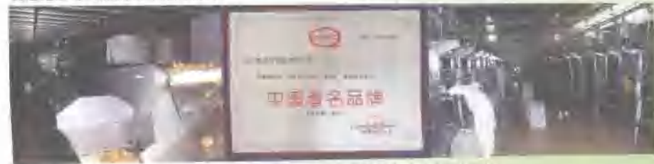
2004年11月，“兔巴哥”系列食品被评为“中国著名品牌”