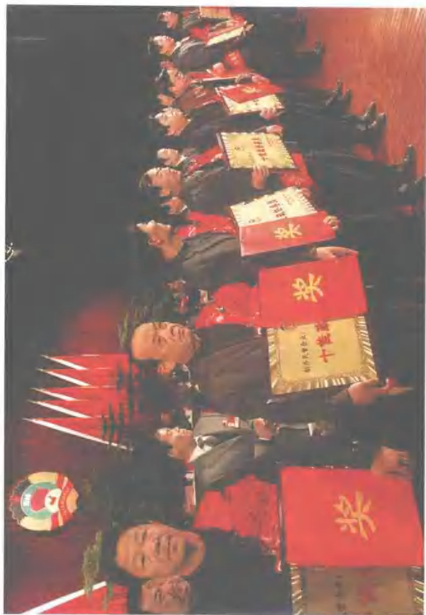
创办、领办民营企业十佳政协委员颁奖