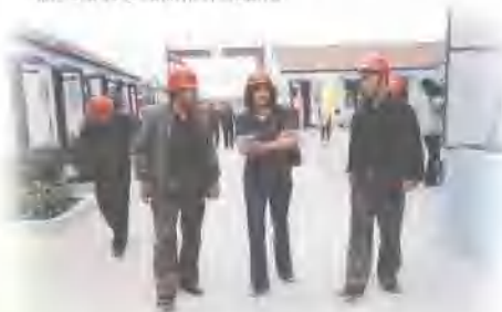
陪同省市主管部门领导验收省级安全文明示范工地