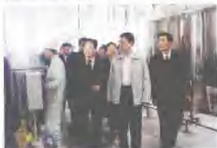
省委书记张高丽带领考察团来我公司检查指导工作。

山东兔巴哥食品有限公司坐落於世界足球发源地、齐国故都——临淄。公司成立于1994年（前身为淄博市临淄广丰食品饮料厂），是一家以生产乳制品、饮料及休闲食品为主的大型现代化食品加工企业。市场网络现已扩展到全国十七个省、直辖市。公司先后通过了国家技术监督局的“无公害产品”认证和ISO9001、2000国际质量体系认证。2002年，“兔巴哥”商标被山东省工商行政管理局认定为“山东省著名商标”，2003年被中国工业协会授予“全国安全优质食品承诺企业”，2003年11月份，获得