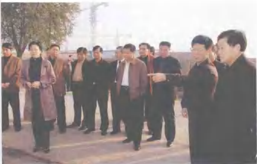
区政协视察齐鲁化工区