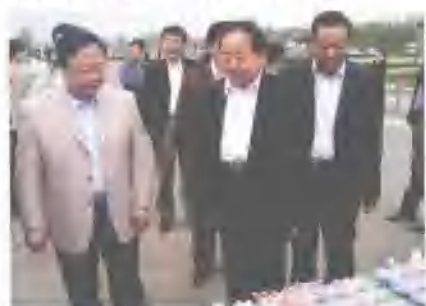
原全国人大常委会副委员长田纪云、全国人大农业与农村委员会副主任李春亭带领考察团来我公司检查指导工作。

山东兔巴哥食品有限公司坐落於世界足球发源地、齐国故都——临淄。公司成立于1994年（前身为淄博市临淄广丰食品饮料厂），是一家以生产乳制品、饮料及休闲食品为主的大型现代化食品加工企业。市场网络现已扩展到全国十七个省、直辖市。公司先后通过了国家技术监督局的“无公害产品”认证和ISO9001、2000国际质量体系认证。2002年，“兔巴哥”商标被山东省工商行政管理局认定为“山东省著名商标”，2003年被中国工业协会授予“全国安全优质食品承诺企业”，2003年11月份，获得