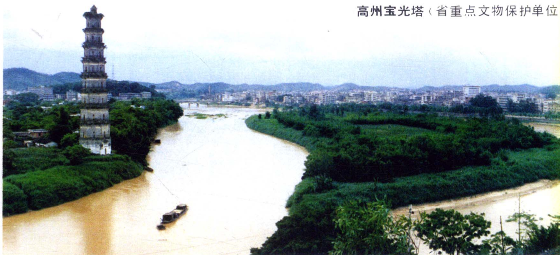
高州宝光塔（省重点文物保护单位）

茂名风光奇丽，名胜颇多，既有幽雅奇趣的龙头山海湾乐园，也有碧波荡漾的虎头山海滩浴场，还有一批典雅的古代建筑，近年来还建起了一批现代化的宾馆，每年吸引前来茂名的游客达40万以上。