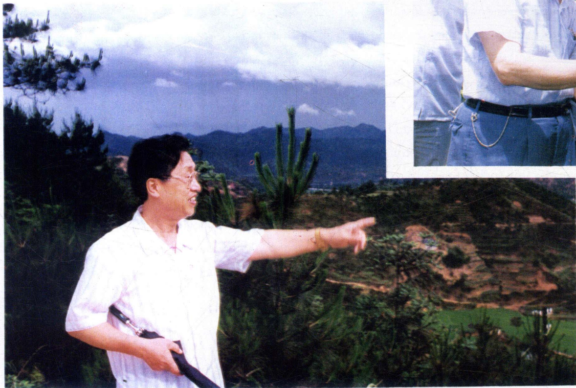
市委书记肖启贵深入山区指导工作