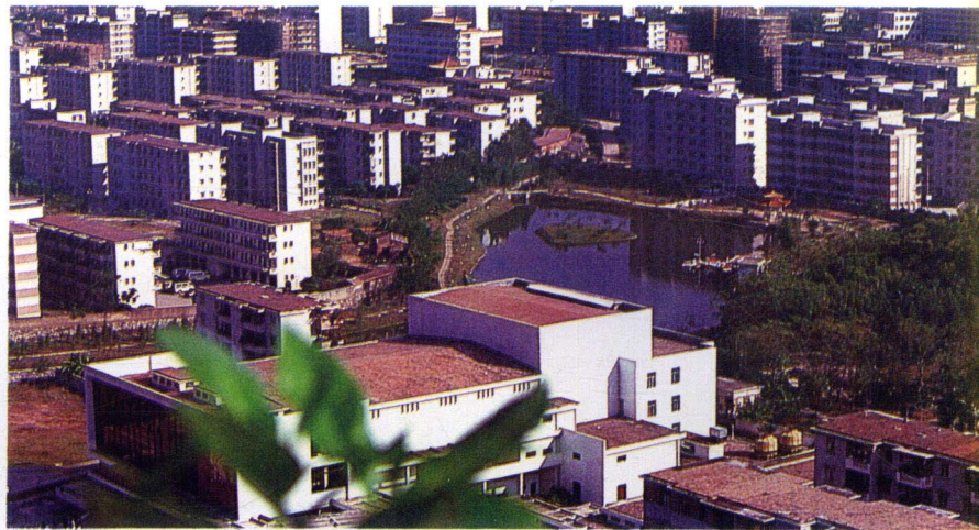
新建河东区住宅群