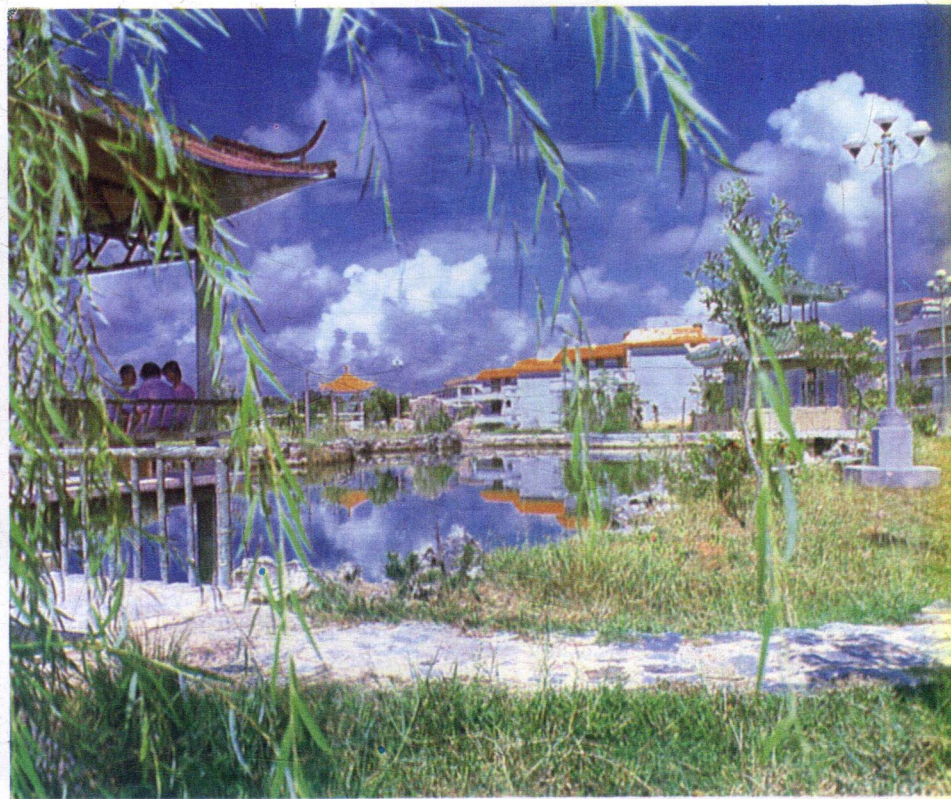
茂油公司职工疗养院