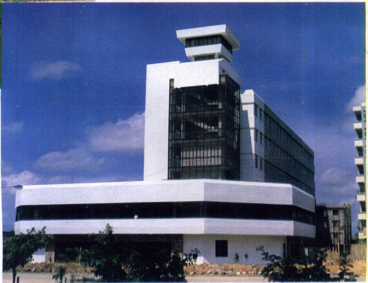
新建的 茂名电信大楼