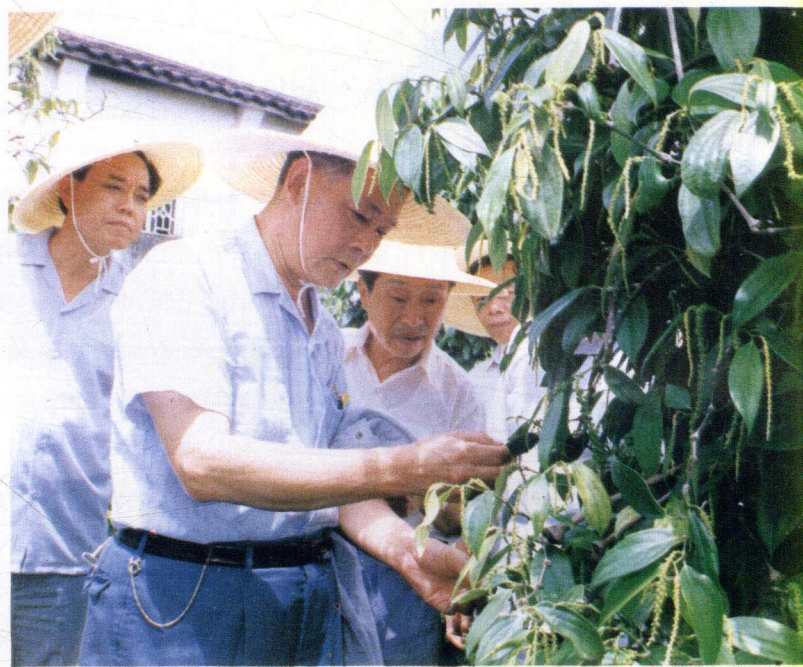
广东省省长叶选平视察茂名工作