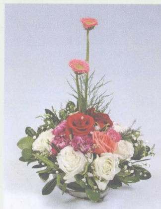
⑦ 用水晶草等充填花泥的空隙处，作品完成。