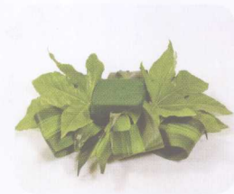
※设计重心强调横向延伸的水平造型。

8. 倾斜型：外形是不等边三角形，主枝的长短视情况而定，整个构图具有左右不平衡的特点。多用于线状花材，可有效表达舒展，自然的美感。