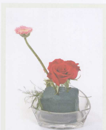
① 在花泥的中心插入太阳菊和红玫瑰，在侧面插些芦笋叶。