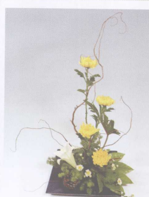
⑥ 重复上一步的动作，使作品更完整。