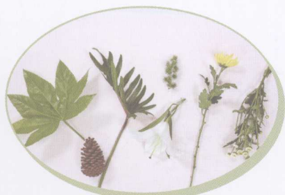
八角金盘 松子 小天使 蓬莱松 百合 秋菊 雏菊