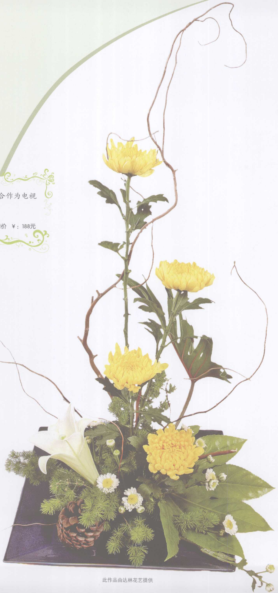
此作品由达林花艺提供