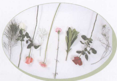
芦笋叶 白玫瑰 粉玫瑰 满天星 太阳菊 康乃馨 海棠叶 红玫瑰 水晶草