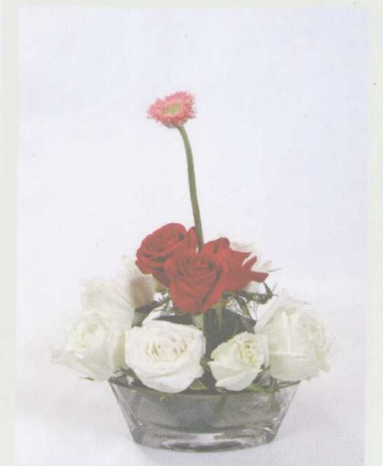
② 沿着花泥插一圈白玫瑰。