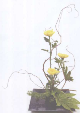
③ 以阶梯状加入秋菊。