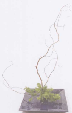
① 垂直插入云龙柳，注意造型，底部用蓬莱松点缀。