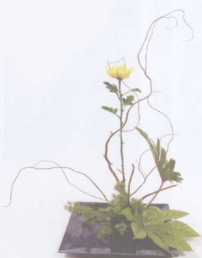
② 垂直插入秋菊，用小天使作影子效果，再加入八角金盘。