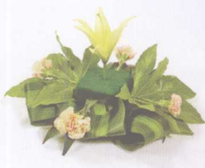
※中央稍微隆起，左右两端则为优雅的曲线设计。