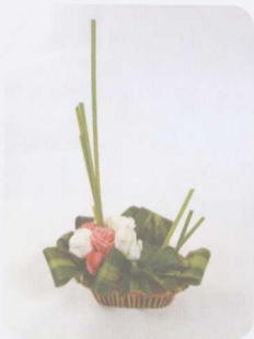
※上下对比度大，左右呈不平衡状态。

就花材与容器的色彩配合来看，素色的细花瓶与淡雅的菊花有协调感；浓烈且具装饰形的大丽花，配釉色乌亮的粗陶罐，可展示其粗犷的风姿；浅蓝色水孟宜插以低矮密集粉红色的雏菊或小菊；晶莹剔透的玻璃细颈瓶宜插非洲菊加饰文竹，并使其枝茎缠绕于瓶身。