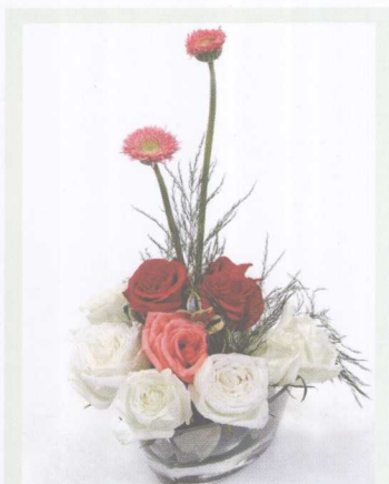
③ 加入粉玫瑰和芦葦草。