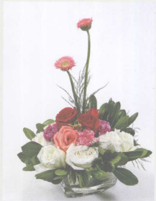
⑤ 用海棠叶修饰作品的四周。