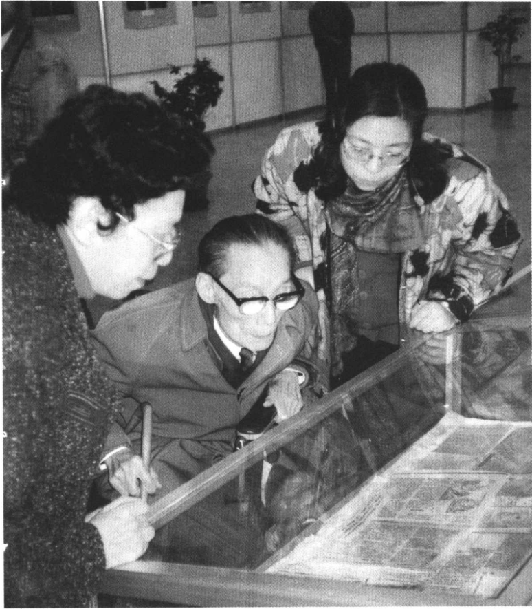
1991年参观“夏衍文学创作生涯六十周年展览”。