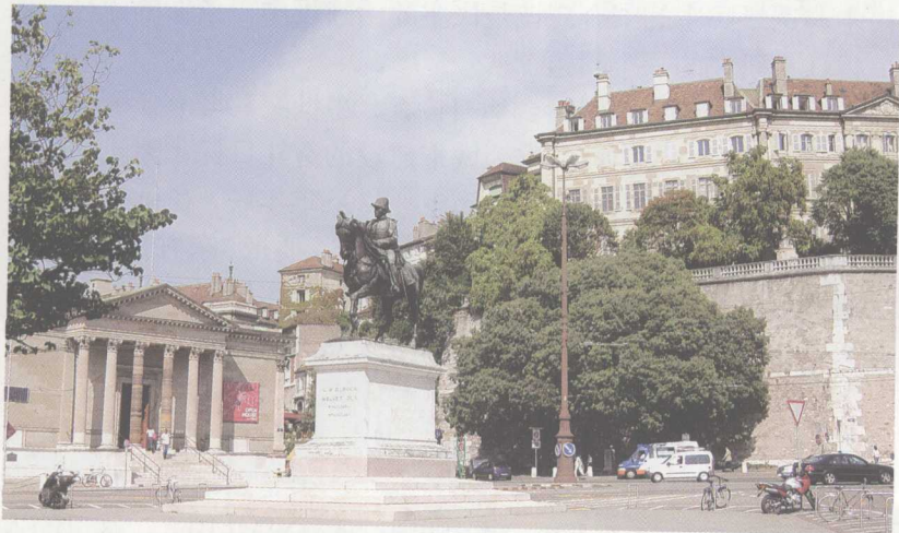
日内瓦老城

瑞士东与奥地利、列支敦士登接壤，南与意大利相邻，西接法国，北连德国。1291年8月1日，乌里、施维茨和下瓦尔登三个州在反对哈布斯堡王朝的斗争中秘密地结成永久同盟，瑞士就此建国。1815年，维也纳会议确认瑞士为永久中立国。1848年制定宪法，设立联邦委员会，瑞士成为统一的联邦制国家。瑞士国土面积有41293平方公里，人口有720万，首都是伯尔尼。瑞士