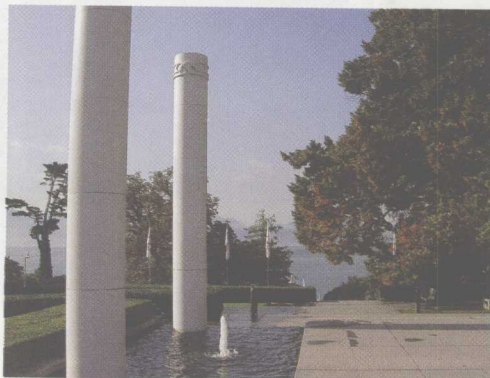
博物馆外景