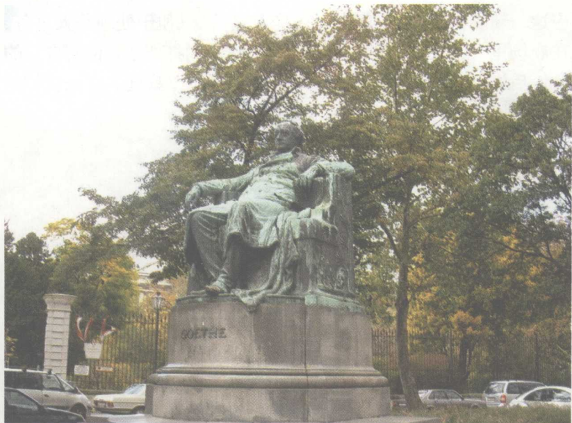
法兰克福市中心的歌德像