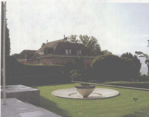
终年不息的奥运圣火