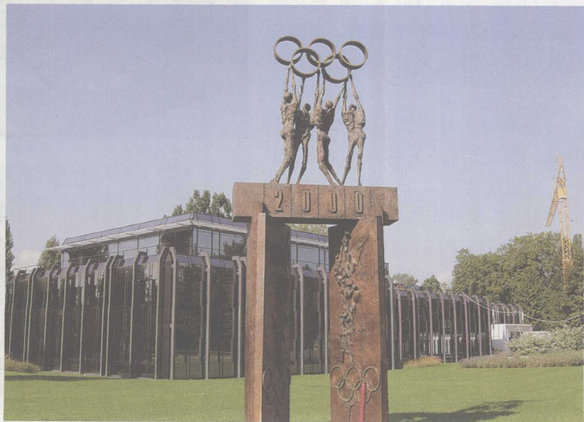
国际奥委会总部