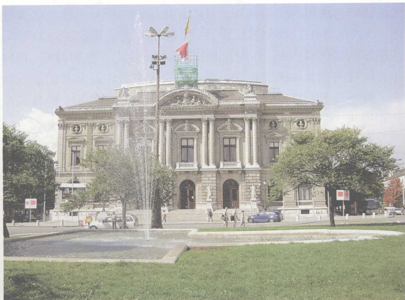
日内瓦一景

即每个成员的共同利益。在卢梭看来，“公意”并非“众意”，两者是有差别的，“公意”只着眼于公共的利益，而“众意”则着眼于私人的利益，是个别意志的总和。一个国家要保持良好的社会秩序，要达成一种公正的社会契约，就需要处理好国家利益、社会利益与个人利益之间的关系，也就是要处理好“公意”与“个人意志”的关系，只有把这一关系处理好了，社会契约才能公正有效，才能较好地实行。而要做到这一点，最重要的就是“每个人都以其自身及其全部的力量共同置于公意的最高指导之下”。