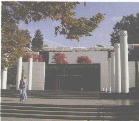
洛桑奥林匹克博物馆

洛桑位于日内瓦湖北部沿岸的中部，是瑞士沃州的首府，也是瑞士第二大讲法语的城市，它和日内瓦、伯尔尼、苏黎世有铁路连接，是通过TGV（法国新干线）到达巴黎的交通中心。洛桑是一座古城，城市不大，只有12.5万人。城市中有许多古建筑，具有浓厚的文化艺术气氛。依山傍水、风景秀丽的洛桑，充满着法国式的浪漫，保留着瑞士式的和谐与宁静。