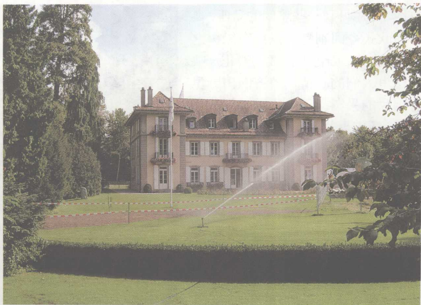
萨马兰奇办公的古建筑