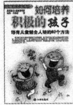
美国著名儿童教育家瑞格·齐格勒 著 定价: 15.00 元