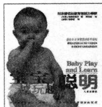
(日) 仲田安津子 著 定价: 22.80 元