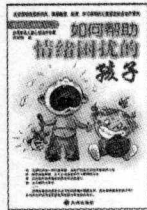
(台湾) 郑信雄 著 定价: 15.00 元