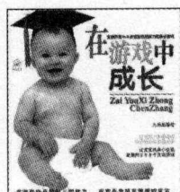
珍藏本双色印刷 定价: 19.80 元