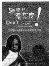
(美) 米歇尔博士著 定价: 26.80 元