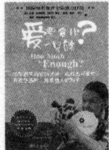
(美) 克拉克博士等著 定价: 23.80 元