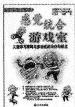
(台湾) 陈文德 著 定价: 19.80 元