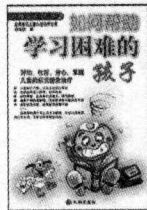
(台湾) 郑信雄 著 定价: 18.00 元