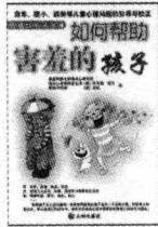
美国耶鲁大学著名心理学家菲利普博士著 定价: 15.00 元