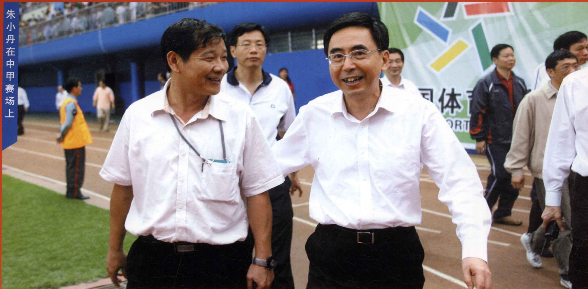
朱小丹在中甲赛场上

“广州是一座拥有深厚足球传统的城市，是南派足球的发祥地。广州人民爱足球，懂足球，足球是他们生活不可缺少的一部分！”