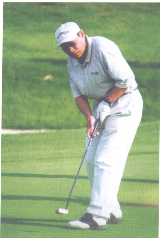
◀2003年7月，在“华远杯”高尔夫球邀请赛上挥杆击球。