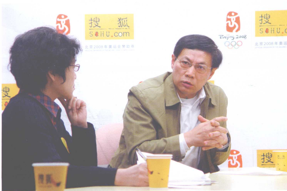
▲参加搜狐网的网络直播论坛。