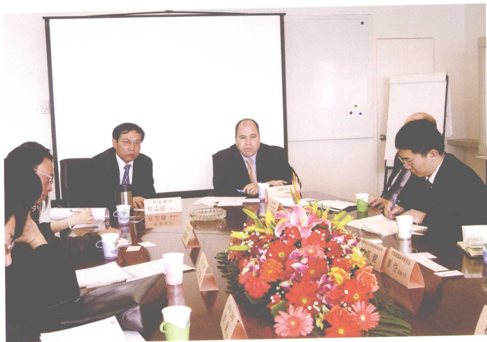
▲2005年3月，与美国联邦住房企业监管办公室管理人员座谈。