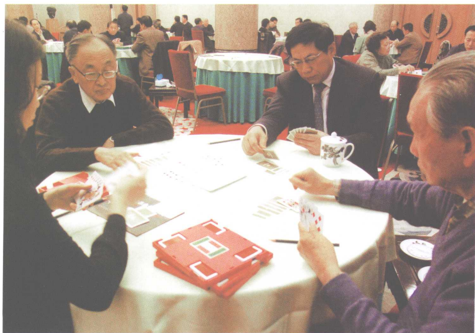
▲在第十八届“华远杯”名人桥牌联谊赛上。