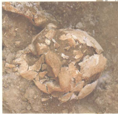
旧石器时代·金牛山人头骨化石 1984年辽宁营口金牛山洞穴出土。金牛山人生活在距今31万年—28万年间，标志着人类开始由直立人向智人的进化。