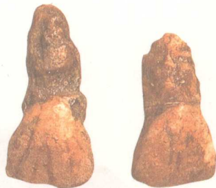
旧石器时代·元谋人门齿化石 1965年云南省元谋县上那蚌村出土。距今约170万年。长1.14厘米。门齿化石呈铲形。现代人种门齿呈铲形的以蒙古人种最多，其它人种的比例较少。

世界人类文化史，就是人类向大自然作斗争、争取主人地位的历史，同时，也是不断克服自身的蒙昧、野蛮的历史。那么，中国历史文化始于何时？可以说，中国大地上悠久而光辉历史的扉页，就是远古这些手持石斧的先民首先掀开的。