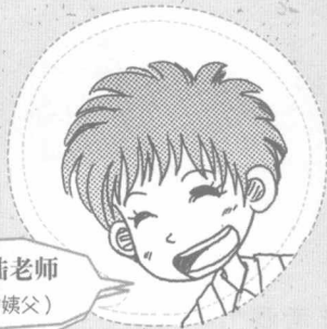
年轻的陆老师 (蓝小鱼未来的姨父)