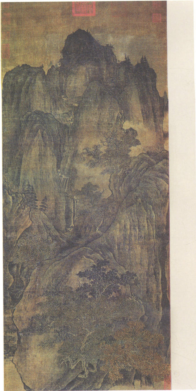
图1-5 【五代】关全《秋山晚翠图》，画面正中为峭拔的主峰，山涧丛生寒林秋树，涧水悬瀑曲折而下，气势雄伟