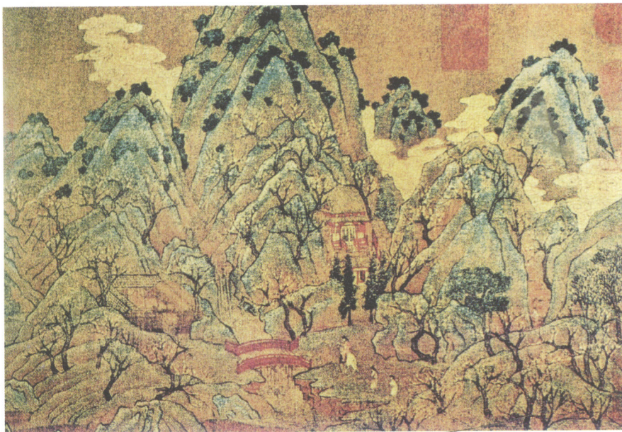
图1-3 中国第一张国画山水——(隋)展子虔《游春图》，描绘春光明媚踏青郊游的情景。画面以青绿为主调，间以红白诸色，和谐中又见变化。图中线条细劲有力，以山川为主，人马点缀其间。人马虽小如豆粒，但一丝不苟，形态毕现。画山石有勾无皴，行笔有轻重粗细、顿挫，但不见皴擦。色彩厚重，鲜艳明亮，烘托出秀丽山河春意勃发的生机。

中国古代的园林，发展到汉代已基本形成综合性的艺术。汉代园林中的假山堆叠，比先秦时代有很大发展。据文献考证，中国园林中的人工叠山至少在孔子生活的春秋时代就出现了。孔子的《论语》中有“为山”、“一篲”之类的说法，与民间口碑相传的“为山九仞，功亏一篲”的俗语正好相合。《三秦记》载：“秦始皇作长池，引渭水。东西二百里，南北二十里，筑土为蓬莱山。”到了汉代，在先秦堆土为山的基础上，更创造了叠石筑山的技法，并在假山中布置山洞，力求接近自然形式。此外，雕塑在园林中已广泛应用，如上林苑昆明池畔的牛郎、织女的石雕，一直保存至今。池中还有长达三丈（约7.5米）的鲸鱼石刻、太液池中的鱼、龙及各种奇禽异兽之类的石刻铜雕等。在许多宫阙上，安置有迎风转动的巨大铜凤；宫苑内时能见到铜人、铜马等。这些雕塑都有助于造园主题思想的表达。据《汉宫典职》载：“宫内苑……激上河水，铜龙吐水，铜仙人衔杯受水下注。”如此层层跌落的铜雕涌泉营造于2000多年前，实在是一件相当令人惊奇的杰作，在世界园林史上也很有价值。