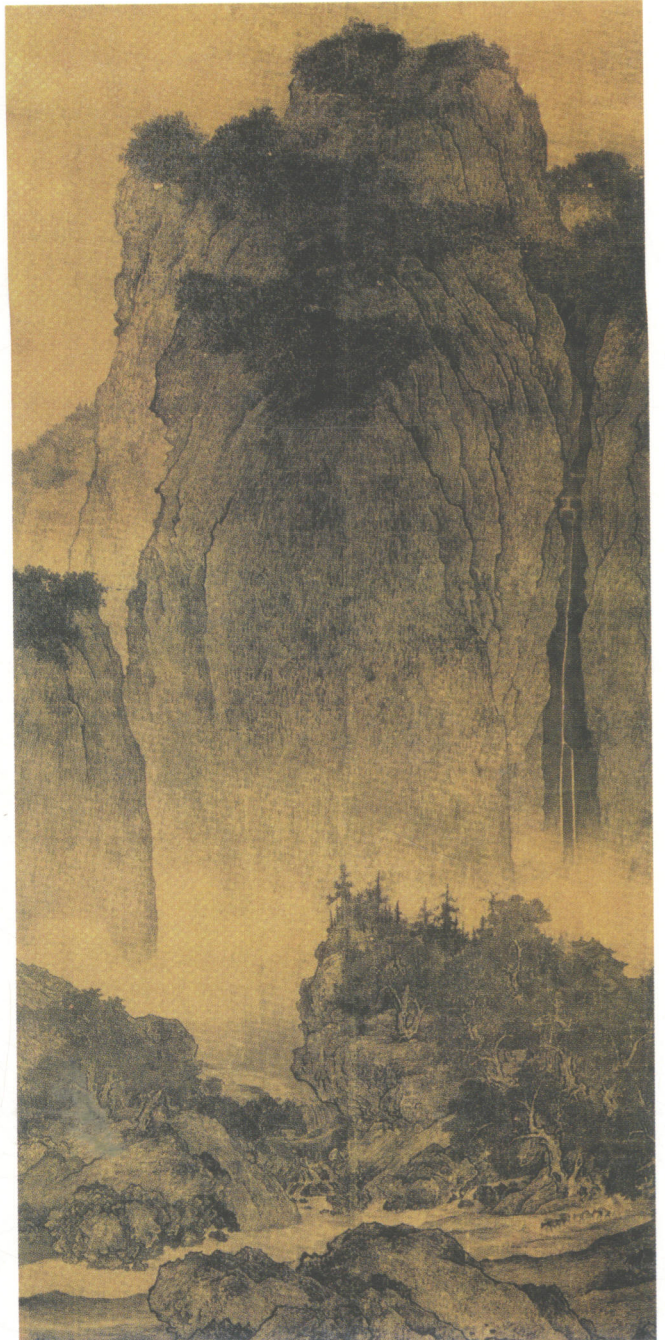
图1-6 【宋】范宽《溪山行旅图》，描绘了关中景色，是中国美术史上的一座丰碑。巍巍大山耸立在画面中央，右侧有深谷瀑布，近景为两块巨大的岩石。山脚下开阔的路上，毛驴行人。中景两座山丘，隔溪相对，山上密布阔叶树与针叶树。中部山坡的丛林后边，若隐若现地显出几栋庙宇，建筑精致结实，与山体的风格融为一体