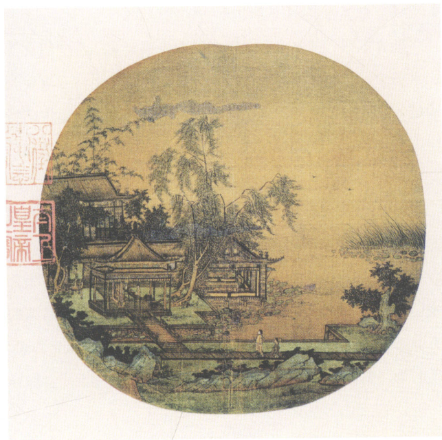
图1-1 [南宋] 赵伯驹《汉宫图》，写意地表现了汉武帝所营造的宫苑景观

“苑中养百兽，天子春秋射猎苑中，取兽无数”，保持着商周以来射猎游乐的传统。然而，建成后的上林苑已不限于射猎之乐，还有多种多样的宫室建筑和声色犬马等游乐活动。《关中记》载：“上林苑门十二，中有苑三十六，宫十二，观三十五”，各具特色。例如，苑中有供游憩的宜春苑，供御人止宿的御宿苑，为太子设置招宾客的思贤苑、博望苑等，有演奏音乐和唱曲的宣曲宫，观看赛狗、赛马和观鱼鸟的犬台宫、走狗观、走马观、鱼鸟观，饲养和观赏大象、白鹿的观象观、白鹿观，引种西域葡萄的葡萄宫和培养南方奇花异木（菖蒲、山姜、桂、龙眼、荔枝、槟榔、橄榄、柑橘等）的扶荔宫等。苑中还穿凿有许多池沼，池名见于载籍的有昆明池、麋池、牛首池、蒯池、积草池、镐池、祀池、东陂池、西陂池、当路池、大一池、郎池等。