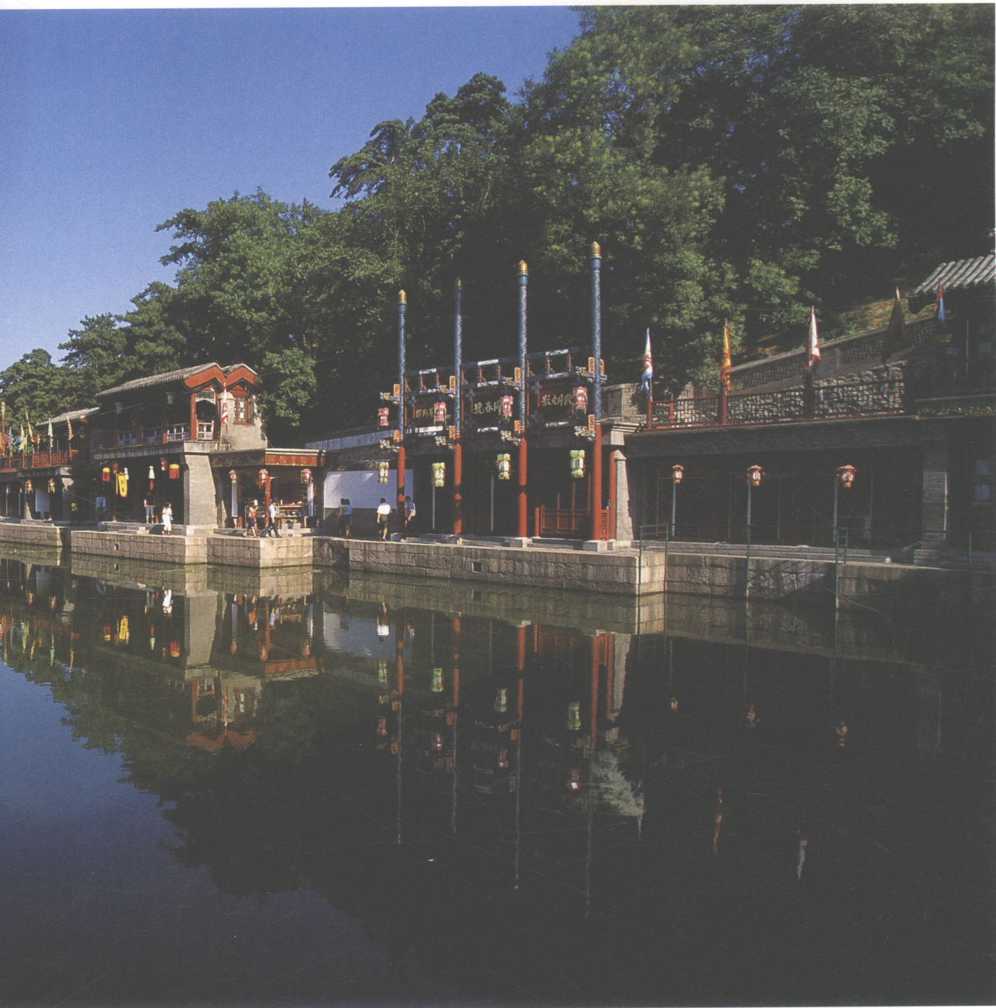
图 0-3 颐和园后湖“苏州街”，在皇家园林里典型地反映了江南水乡市井生活的景观与乐趣

园林营造中的体现。与西方园林艺术相比，中国古典园林集中地抒发了中华民族对于自然和美好生活的向往与热爱，是一种诗意化的游憩生活空间，也是博大精深的中华文化宝库中的一朵奇葩。