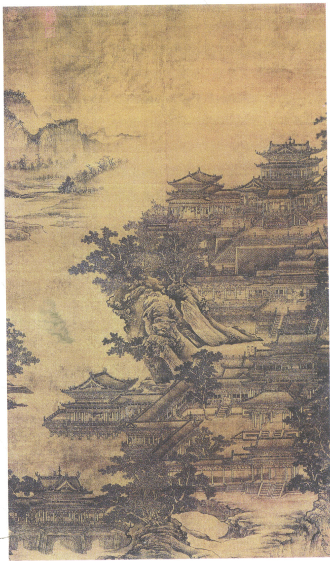
图1-2 [元] 李容瑾《汉苑图》，表现了汉代皇家园林的宏伟规模和精湛建筑工艺

汉代的造园家们，对于水景的处理已有相当熟练的技巧。在汉代宫苑中，人工开挖的大水面很多；凿池堆山，奠定了此后将近2000年中国古典园林中皇家园林营造的基本山水结构。这些大水面的使用，主要是描写幻想中所谓神仙起居出没的环境——浩渺冥迷的海中仙山与星光灿烂的天上河汉。如汉武帝凿于建章宫北的太液池，便以象征北海为主题，池中布置了三个岛屿，以象征蓬莱、方丈、瀛洲三座神山。上林苑周回四十里的昆明池中设置“豫章台”，沧池中设置“渐台”，都是取“蓬岛瑶台”的寓意。昆明池的东西两岸，还分别设置了牛郎、织女的雕像，用以表示池水是象征