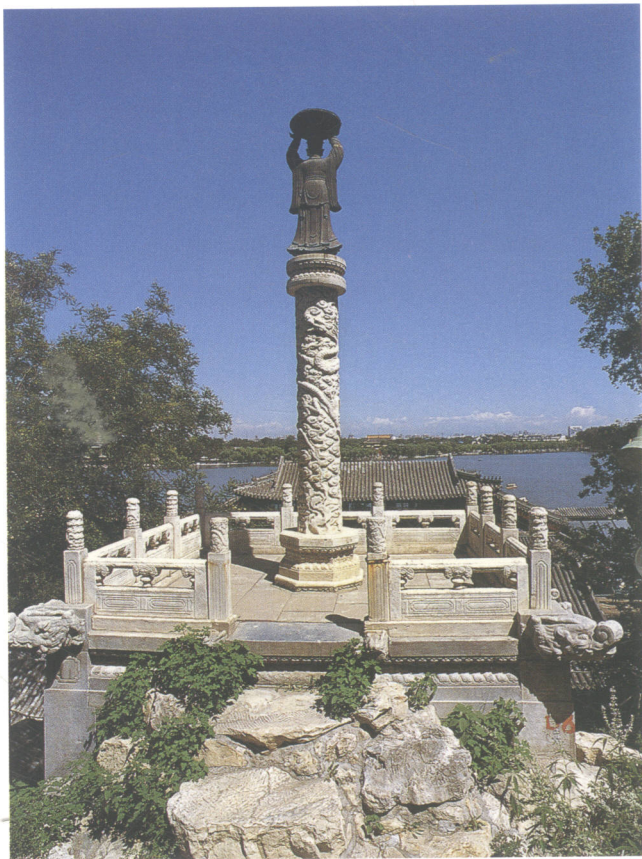
图0-2 北海琼华岛上的“仙人承露台”，集中地体现了中国园林“天人合一”的造园艺术理念

据史料考证，“园林”一词广泛见之于西晋以后的诗文中。如西晋张翰的《杂诗》云：“暮春和气应，白日照园林；青条若总翠，黄花如散金……”同时期的文人左思（公元250~350年，字太冲，临淄人）写有著名的《娇女》诗，描写他的小女儿像只小鸟在园林中飞翔，有“驰鸢翔园林”的句子。其后，南北朝何承天的《雉子游原泽》诗中写有：“饮啄虽勤