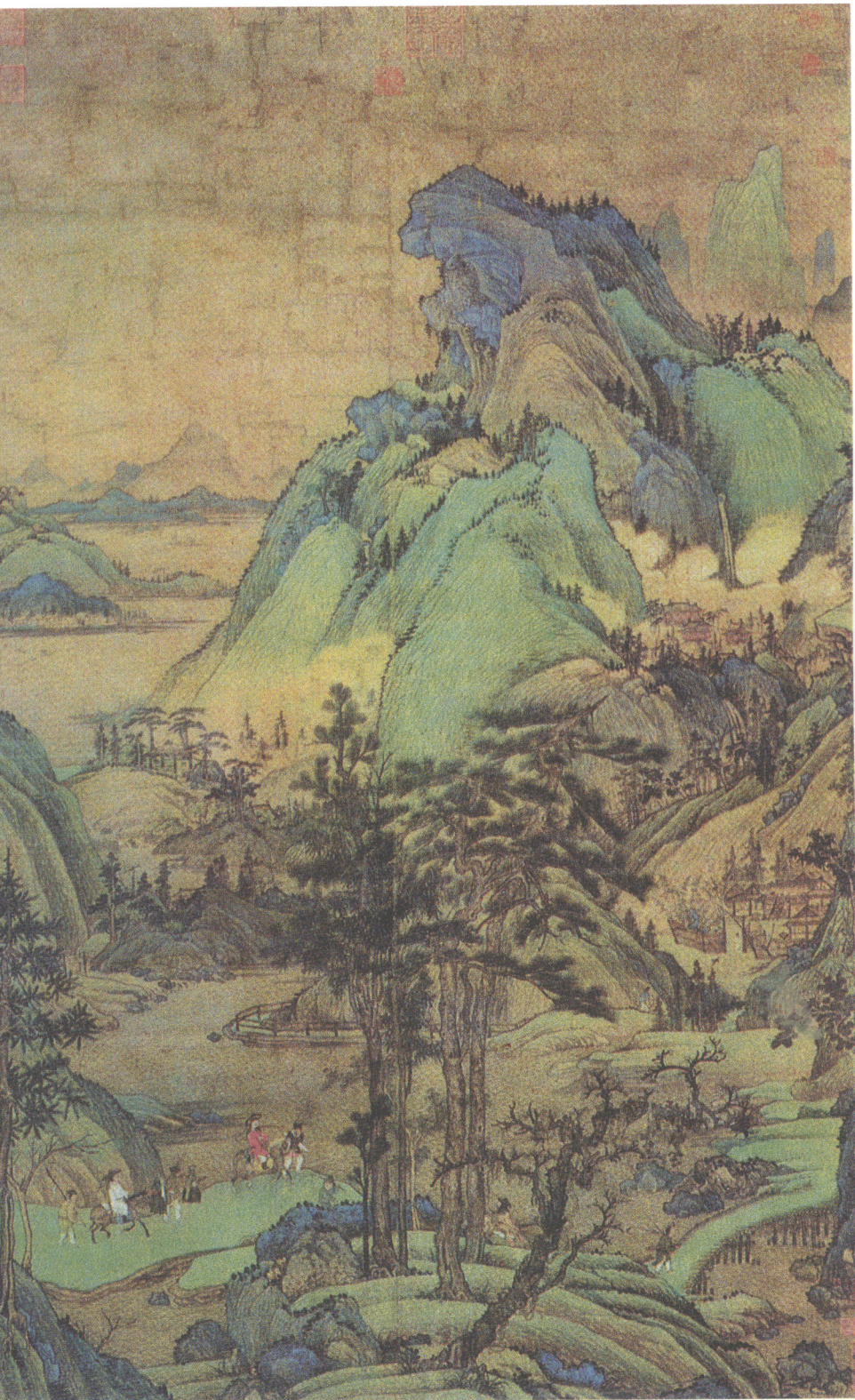
图1-4 【五代南唐】董源《江堤晚景图》，描绘了王维笔下山林幽居、风花雪月的自然式园林意境。董源开创了平淡天真的江南画派，发展了唐代王维的水墨一脉，丰富了山水画的表現技法，对宋元两代士大夫文人山水画有重要影响

三苑(西内苑、东内苑和禁苑)。太极宫的规模最为宏伟，占地约340公顷。在大明宫内，不仅有崇台上雄伟的含元殿，还有居于宫北的太液池(又名“蓬莱池”)，池中有蓬莱山(岛)独踞。池周建回廊四百多间，别有一番景色。