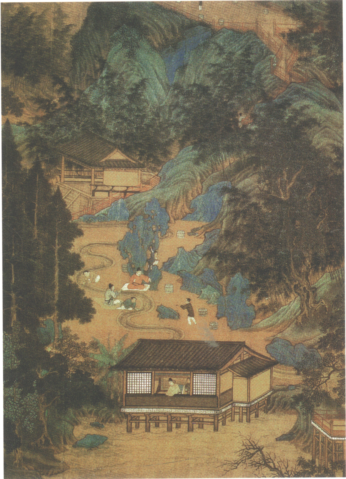
图 0-1 [明] 仇英《园林胜景图》，仇英（1493—1560 年），字实父（甫），号十洲，苏州府太仓人，明代“吴门画派”四大家之一，擅长人物，尤长仕女，又善山水、花鸟，以工笔重彩为主。作品描绘了江南山水及园林景物，表现了当时文人园居生活的悠闲意趣