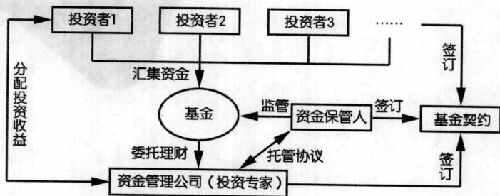
图 1-1 基金简略示意图

打个比方就是几个人（比如甲和乙）一起出钱想投资，可他们对这方面不懂，于是找到他们的朋友丙，丙对这方面很在行。于是甲出60元，乙出40元，一共100元交给丙请他帮忙投资。这100元钱就可以算是一个基金，将来不管赚了钱或是赔了钱，甲和乙都要按投资的比例承担，和丙没关系。在现实生活中，丙就代表了基金公司，而甲和乙就成了“基民”。