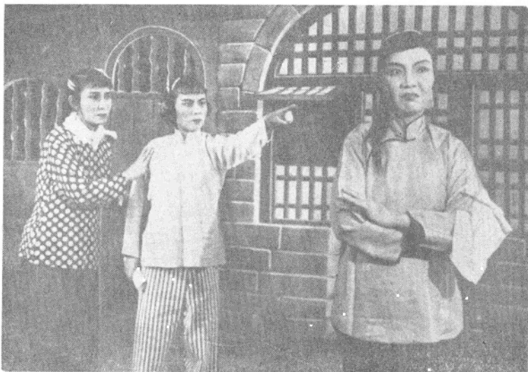
第四場 端阳、桂叶与胡妻展开斗争。